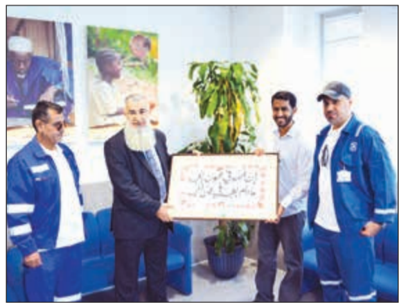
وقد من «نفط الكويت» سلم الشحنة