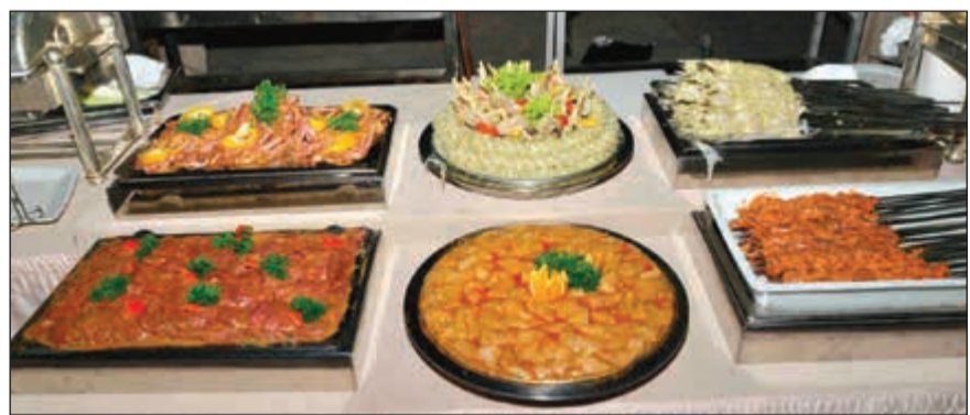
جانب من الاطعمة في الباربيكيو