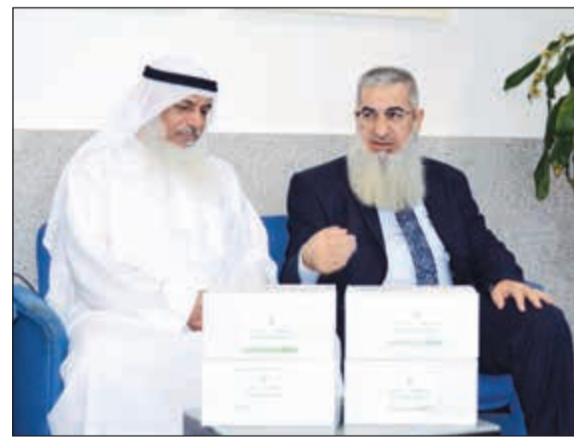
«العون المباشر» ستوزع التمور على المحتاجين في أفريقيا

الأسر الأفريقية والتي تعد التمور وجبة عزيزة عليهم.