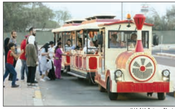
أنشطة ممتعة للأطفال

عوامل مجتمعة منها عراقة الخبرة وجودة المنتج. وشدد الشلال على أن المؤسسة تطرح جديدا لهذا الموسم ضمن مجموعة جديدة من القطور الفرنسية المميزة بجمال الرائحة وقوة الثبات بتصورها عطرها الفريد والمميز جدا BLACK WOOD إضافة إلى توافر عطورها الأخرى الذائقة الصيت كعطر المسك وعطر النفل وعطر العود، حيث تلقى اقبالا كبيرا لدى عملائنا. وأشار الشلال إلى أن «زين العود» تتميز بدقة اختياراتها الغنية بالزيوت العطرية، المستخدمة فيها دهن العود الطبيعي بالإضافة إلى