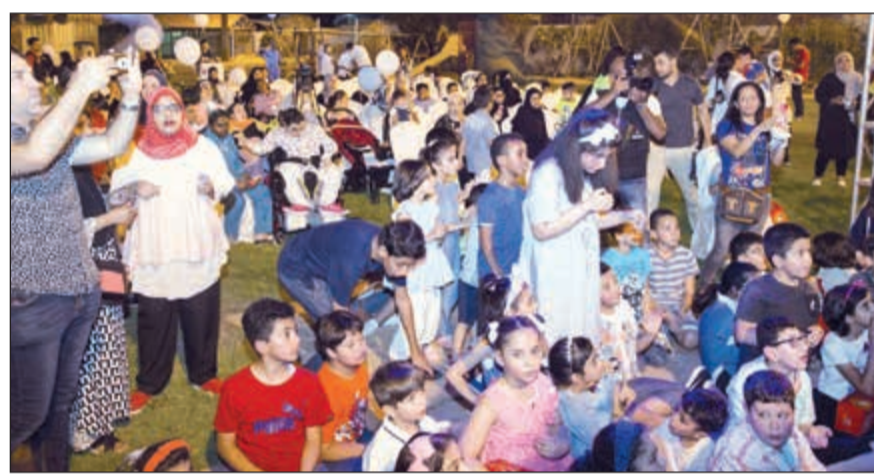
جانب من الأنشطة

تأتي رعاية بنك الخليج لهذه الفعالية في إطار التزامه المتواصل ودعمه المستمر للقضايا الاجتماعية الرئيسية من خلال برنامج