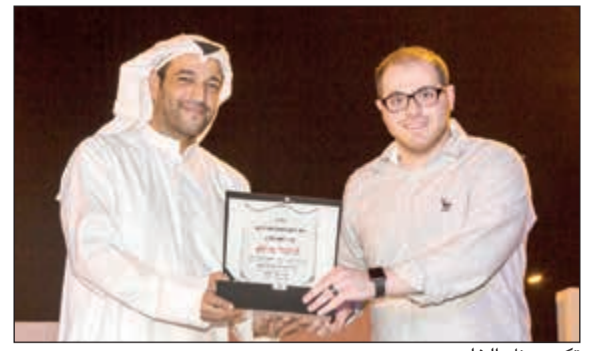
تكريم بنك الخليج