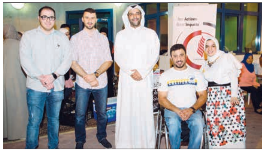
بنك الخليج رعى الحفل الذي نظمه مركز الخرافي

قام بنك الخليج مؤخرا برعاية الحفل الختامي لأنشطة الصيفية، الذي نظمه مركز الخرافي لأنشطة الأطفال المعاقين، في مقر المركز بمنطقة مشرف. حضر الحفل الأطفال المشاركون في البرامج الصيفية وأولياء الأمور إلى جانب العديد من الشخصيات المهتمة بهذه الفئة. حرص مركز الخرافي لأنشطة الأطفال المعاقين على توفير البيئة الترفيهية المتخصصة والأمن التي تكفل لجميع فئات الأطفال المعاقين حق اللعب والاستمتاع، على مدار العام، في أجواء مفعمة بالأمل، وتبعث على البهجة والسورور. كما يهدف المركز أيضا من خلال الأنشطة إلى تطوير مهارات هؤلاء الأطفال الجسدية والاجتماعية واللغوية ودمجهم في المجتمع من حولهم.