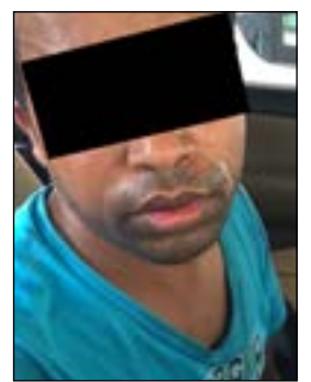
الآسيوي خلال اعترافاته أمام الاب

تصرف الاب بالتصرف الحكيم، ان لم يقدم على ارتكاب فعل متهور قد يضعه تحت المساءلة القانونية، وانما قام بتوثيق الاعترافات بالسائق وارفق الاعترافات بالمقطع الذي التقطته الفتاة ويظهر الفعل الخادش للحياة الذي ارتكبه السائق الآسيوي دون مراعاة لوظيفته، وأن