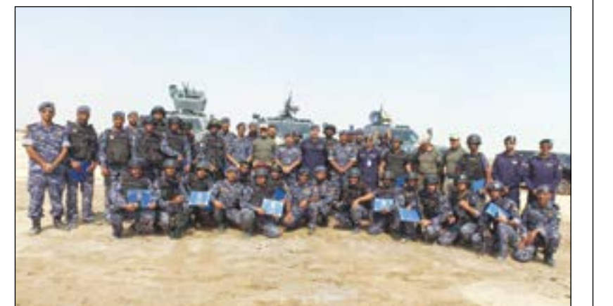
المشاركون في الدورة التقدمية

تدريبية وهي مرحلة الرمايات التقدمية والتكتيكية على بندقية (16 M) ومرحلة تكتيكات القتال في المناطق المبنية ومشروع خارجي في جزيرة فيلكا عبارة عن تطبيقات كاملة باستخدام الذخيرة الحية. وقد هنا اللواء شكري النجار المشاركين بالدورة وطالبهم ببذل المزيد من الجهد والعطاء والاستفادة من هذه الدورة في حياتهم العملية، وقام بتوزيع شهادات التقدير على مجتازي الدورة.