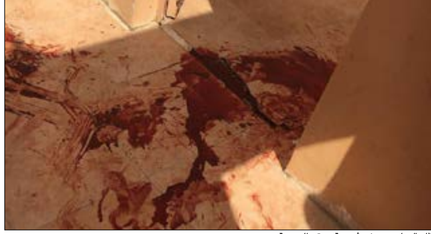
آثار الدماء تبدو في أرضية موقع الجريمة