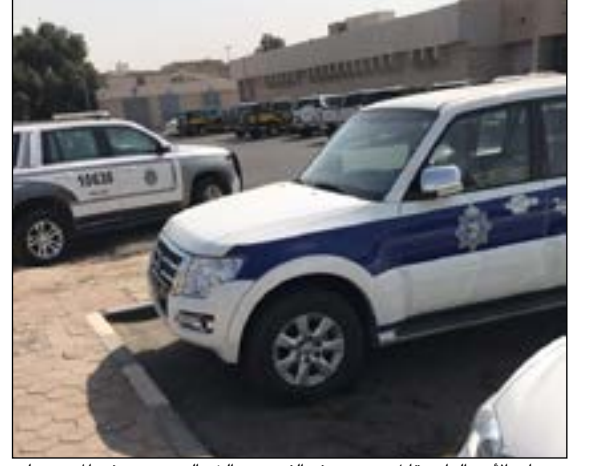
دوريات الأمن العام مقابل مستوصف الفردوس الشمالي حيث توفي المجني عليه

قتل فقط او حتى ضرب أفضى الى الموت سنقوم به النيابة العامة بعد الاستماع الى كامل الاعترافات التي سيدلي بها القاتل. وأشار المصدر الى ان واقعة القتل العمد مرهونة بان الجاني كان يحوز اداة الجريمة وينتظر الجاني، ولكن اذا ثبت ان هناك مشادة بينهما فقام الجاني بالتوجه الى منزله واحضار السكن فإبته في هذه الحالة قد تصنف باعتبارها قتل او ضربا افضى الى الموت. هذا، وتبين من معاينة جثة المجني عليه انه تلقى طعنة نافذة في القلب.