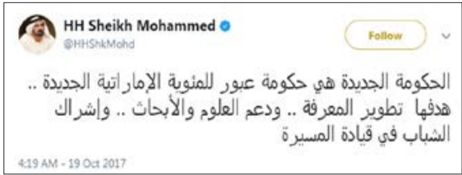
أحد تغريدات صاحب السمو الشيخ محمد بن راشد آل مكتوم نائب رئيس الإمارات التي أعلن عبرها التعديل الحكومي

وجه نائب رئيس الإمارات الشكر للوزراء الذين خرجوا من التشكيلة الجديدة، مشيراً إلى أن «صقر غباش (وزير الموارد البشرية والتوطين) قضى 4 عقود من حياته في خدمة بلادنا مخلصاً ومتفانياً ومحباً للناس.. لك من شعب الإمارات التقدير يا صقر».