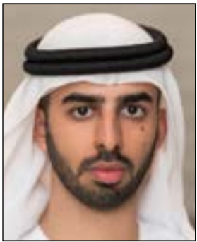
عمر بن سلطان

كذلك أعلن عن تولي وزير الصحة عبدالرحمن العويس إضافة لمهامه الحالية منصب وزير الدولة لشؤون المجلس الوطني (المُنصب الذي كانت تشغله نورة الكعبي وزيرة الثقافة الجديدة). كما تم تعيين عبدالله محمد بن طوق أميناً عاماً لمجلس الوزراء.