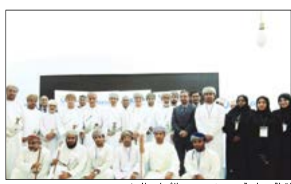
لقطة جماعية بعد وضع حجر الأساس للمشروع