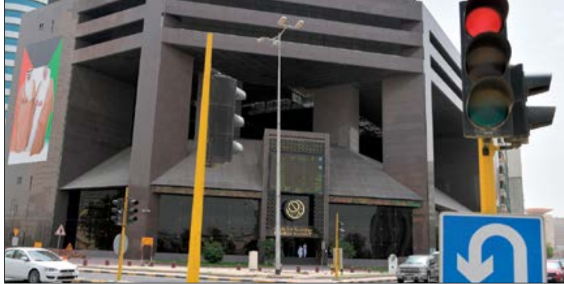
البورصة في الاتجاه الهابط.. وتداول على نتائج الربع الثالث

وكان أهم العوامل المؤثرة في مجمل أداء السوق، استمرار عمليات البيع على بعض الأسهم القيادية بهدف جني الأرباح بعد الارتفاعات السعرية في الفترة التي سبقت الإعلان عن ترقية البورصة، وهو أمر منطقي بعد موجة صعود دامت لفترة طويلة نسبياً. وتترقب البورصة إفصاحات الربع الثالث لعدد المتعاملين سواء كانوا أفراداً أو محافظ وصناديق في تكوين المراكز الاستثمارية