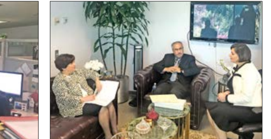
د. محمد الفارس خلال لقائه مع د. أسيل العوضي في مكتبنا الثقافي لدى واشنطن

برامج لربط المكاتب الثقافية مع وزارة التعليم العالي، لاسيما المكتب الثقافي في واشنطن والمكتب الثقافي في لوس أنجلوس، مؤكداً ان عملية ربط المكاتب مع بعضها البعض وصلت إلى مراحلها الأخيرة. ودعا الطلبة الكويتيين الموجودين في الولايات المتحدة إلى التسليح بأعلى درجات العلم لخدمة وطنهم الكويت في شتى الميادين، راجياً لهم كل التوفيق والنجاح. وقال إن «طلبتنا يمثلون بلدهم في الخارج. ومن المهم أن يكونوا واجهة تعكس دور الكويت الحضاري والثقافي