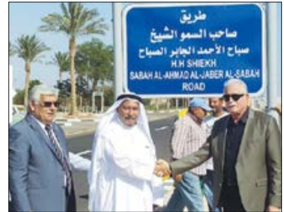
السفير محمد الذويخ واللواء خالد فودة واللواء عبدالفتاح حلمي خلال مراسم إطلاق اسم سمو الأمير الشيخ صباح الأحمدي على أحد أهم شوارع «شرم الشيخ»

«لكل ما من شأنه أن يطور ويدعم ويعزز هذه العلاقة التاريخية المتجذرة». واعتبر ان هذا الحدث يمثل «عنواناً بارزاً على العلاقات المميزة والأخوية والتاريخية التي تربط بين البلدين الشقيقين وتقديراً من القيادة والشعب في مصر لصاحب السمو الأمير ومكانته لدى إخوانه في جمهورية مصر العربية». وأشار إلى ما يحظى به الشارع الذي يمتد لمسافة 5 كيلومترات من أهمية لكونه تقع فيه «قاعة المؤتمرات الدولية» وفي نهايته مجموعة من المنتجعات السياحية ومتفرع من (طريق شرم الشيخ). وذكر السفير الذويخ أنه سيتم خلال الفترة المقبلة بالتوافق مع محافظ جنوب سيناء وضع بعض