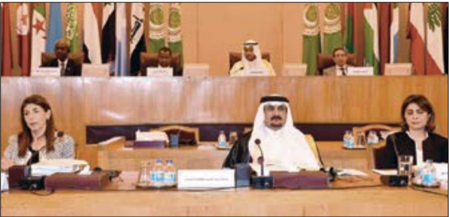
الشيخ عبدالله الأحمدي مترسدا الدورة الـ 29 لمجلس الوزراء العرب المسؤولين عن شؤون البيئة

المؤسسات الحكومية بالمساهمة في وضع الحلول لكثير من المشاكل البيئية. ودعا الشيخ عبدالله الأحمدي المنظمات العربية المتخصصة والمنظمات الإقليمية وشركاء مجلس الوزراء العرب المسؤولين عن شؤون البيئة، إلى «إيجاد صيغة أو إطار تشريعي استرشادي يساهم في دعم هذا الاتجاه».