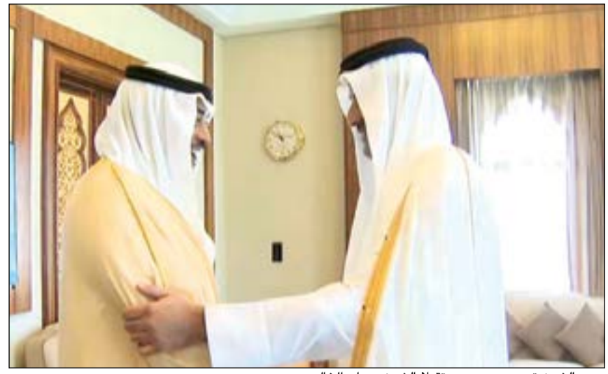
سمو الشيخ تميم بن حمد مستقبلاً الشيخ صباح الخالد

وكان في وداعه لدى مغادرته مطار الكويت متوجهاً إلى الدوحة مساعد وزير الخارجية لشؤون المراسم السفير ضاري العجران ومساعد وزير الخارجية لشؤون مكتب النائب الأول لرئيس مجلس الوزراء ووزير الخارجية بالإنابة السفير صالح اللوغاني.