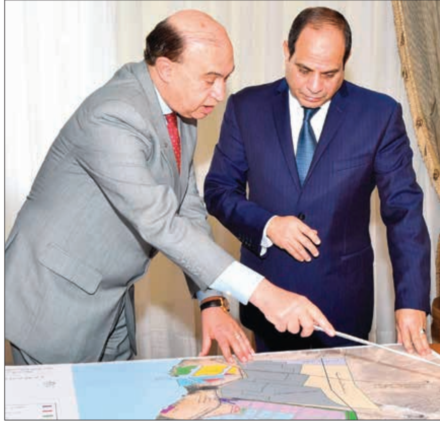
الرئيس عبدالفتاح السيسي يستمع من الفريق مهيب ميمش إلى آخر تطورات المنطقة الاقتصادية لقناة السويس

من جهة أخرى، وجه السياسي خلال اجتماع أمس مع رئيس هيئة قناة السويس رئيس