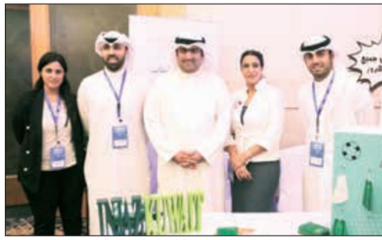
خالد الروضان متوسلا مسؤولي جمعية إنجاز الكويتية

شاركت جمعية إنجاز الكويتية في النسخة الثانية لمؤتمر «عرب نت الكويت» بصفتها «شريكا داعما»، والذي أقيمت فعالياته يومي 17 و18 الجاري، تحت رعاية وزير التجارة والصناعة ووزير الدولة لشؤون الشباب خالد الروضان. وتأتي مشاركة جمعية إنجاز الكويتية في المؤتمر من منطلق حرصها الدائم على التواجد في الفعاليات والمبادرات التي تهدف إلى دعم الشباب الكويتي، وتعزيز ثقافة التطوع وخدمة المجتمع من خلال شركات فاعلة بين كل من قطاع الأعمال بمختلف مجالاته، واستقطاب المدربين والمرشدين المتطوعين من شركات ومؤسسات القطاع الخاص، من أجل تحقيق مهمة إنجاز المتمثلة في «تمكين الشباب لتحقيق طموحاتهم نحو اقتصاد أفضل». ساهمت جمعية إنجاز الكويتية في تعليم ما لا يقل عن 54,336 طالبا وطالبة منذ بداية نشأتها في العام 2005