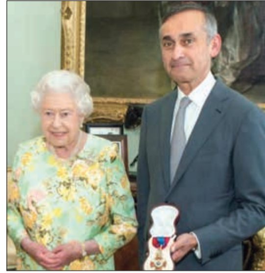
الملكة إليزابيث الثانية خلال منحها اللورد البريطاني آرا دارزي رتبة فارس

والمستشار الحالي للملكة إليزابيث وأحد أفضل جراحي العالم والذي نال رتبة فارس ولقب لورد من الملكة لاختراعاته وإنجازاته في مجال الطب والجراحة، حيث يشغل اللورد دارزي منصب رئيس المركز العالمي للابتكارات الصحية وكذلك رئاسة قسم الجراحة في Imperial College London. وسيقوم اللورد دارزي بلقاء د.أحمد نبيل شخصياً لرؤية وتجربة اختراعه على أرض الواقع وإعطاء رأيه بالاختراع بكل صراحة ودون أي مجاملة، وهذا ما يشكل تحدياً كبيراً للطبيب الكويتي الشاب، وسيتم عرض نتائج هذا اللقاء يوم الجمعة القادم.