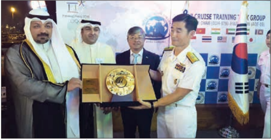
الشيخ يوسف العبدالله يقدم درعا تذكارية لقبطان السفينة بحضور الوزير ياسر أبل والسفير يو يونتشنول

ولفت إلى أن هذه الزيارة تعتبر خاصة بالنسبة له، لاعتبارها المرة الأولى التي يكون فيها أمر من القوة البحرية الكويتية على متن إحدى السفن البحرية لجمهورية كوريا الجنوبية في الكويت، وذلك أود أن اغتنم هذه الفرصة لأشركم جميعاً على هذه الزيارة وأتمنى لكم إقامة ممتعة وأمل أن تتحقق كل الأهداف المرجوة من هذه الزيارة. من جهته، أعرب سفير كوريا الجنوبية لدى الكويت يو يونتشنول عن سعادته بالحضور الكبير والتمثيل الحكومي والديبلوماسي الرفيع على متن المدمرة الكورية والتي تشكل زيارتها منحنى جديداً في العلاقات الثنائية بين البلدين الصديقين، وستفتح آفاقاً جديدة للتعاون بينهما وخصوصاً التعاون العسكري. ولفت إلى حرص البلدين والرغبة الأكيدة على تعزيز التعاون المشترك على كل الأصعدة ومختلف مجالات التعاون، موضحاً أن التقدم الكبير والتكنولوجيا الحديثة التي تستخدمها وتطبيقها القوات البحرية الكورية يفتح مجالاً جديداً للتعاون الثنائي بين البلدين.