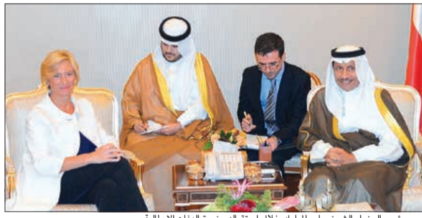
سمو رئيس الوزراء الشيخ جابر المبارك خلال استقباله وزيرة الدفاع الإيطالية

استقبل سمو رئيس مجلس الوزراء الشيخ جابر المبارك وبحضور نائب رئيس مجلس الوزراء وزير الدفاع الشيخ محمد الخالد ووزيرة الدفاع في جمهورية إيطاليا الصديقة السيناتورة روبرتا بينوتي والوفد المرافق لها وذلك بمناسبة زيارتها للبلاد.