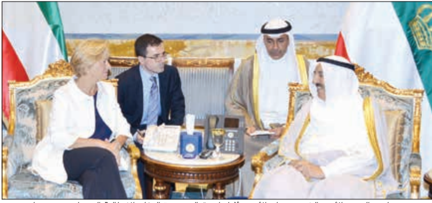
صاحب السمو الأمير الشيخ صباح الأحمد أثناء استقباله وزيرة الدفاع الإيطالية السيناتور روبرتا بينوتي

حضر المقابلة نائب وزير شؤون الديوان الأميري الشيخ علي الجراح.