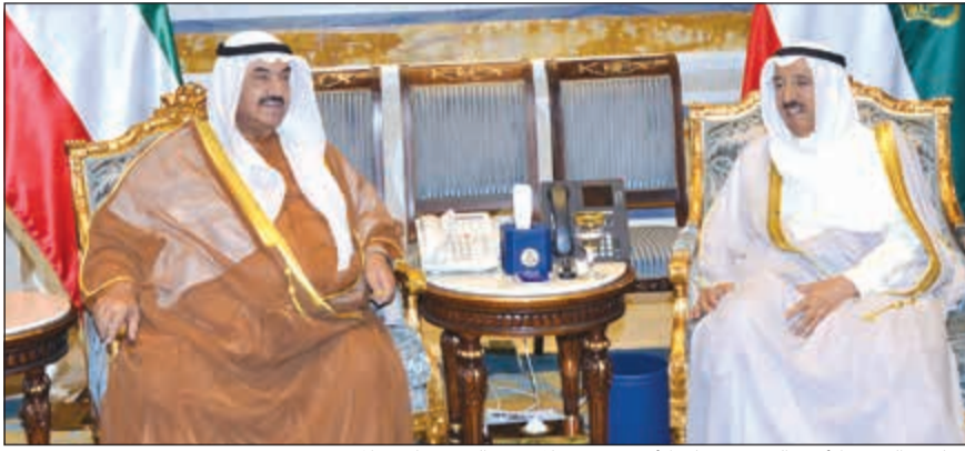
صاحب السمو الأمير الشيخ صباح الأحمد مستقبلاً سمو الشيخ ناصر المحمد

استقبل صاحب السمو الأمير الشيخ صباح الأحمد بقصر بيان صباح أمس سمو الشيخ ناصر المحمد، كما استقبل صاحب السمو الأمير الشيخ صباح الأحمد بقصر بيان صباح أمس وزير الأشغال العامة عبدالرحمن المطوع، حيث قدم لسموه مدير عام الهيئة العامة للطرق والنقل البري أحمد الحصان، وذلك بمناسبة تعيينه في منصبه الجديد.