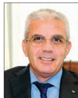
السفير رامي طهبوب

وأضاف ان السفارة ستعمل على إصدار تصريح دخول لمن يرغب في الذهاب إلى فلسطين للاطمئنان والتأكد بنفسه من وضع عقاره، مبيناً في الوقت ذاته ان من لديه معلومات بامتلاكه عقارات في فلسطين ولا يملك أوراقاً ثبوتية بشأنها فيمكنه التوجه إلى السفارة ليتم التحري عنها. وبين ان هناك