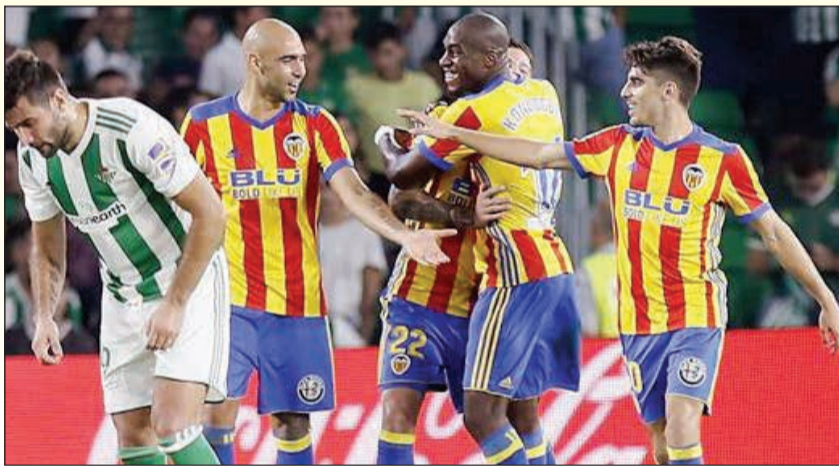
فرحة رجال فالنسيا بالانتصار

حقق فريق فالنسيا فوزا ثمينا على حساب ريال بيتيس بستة أهداف مقابل ثلاثة ضمن الجولة الثامنة من الليغا.