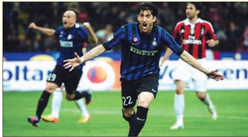
هاتريك ميليتو أمام ميلان

سجل الدولي الأرجنتيني ماورو إيكاردي مهاجم إنتر ميلان ثلاثة أهداف في مرمى نظيره ميلان بالدوري الإيطالي.