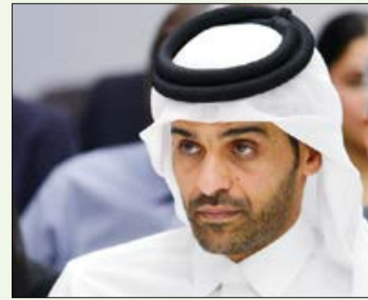
الشيخ محمد آل ثاني