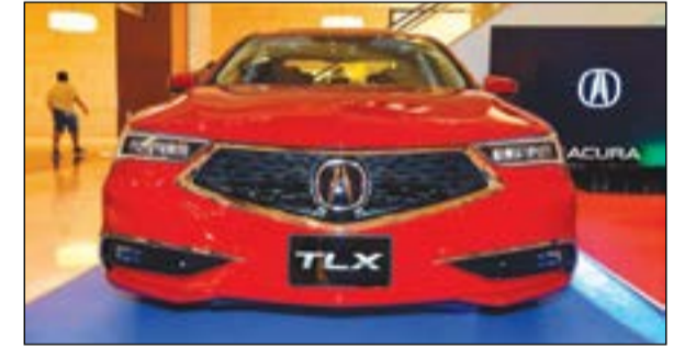
سيارة ACURA TLX 2018 بعد الكشف عنها