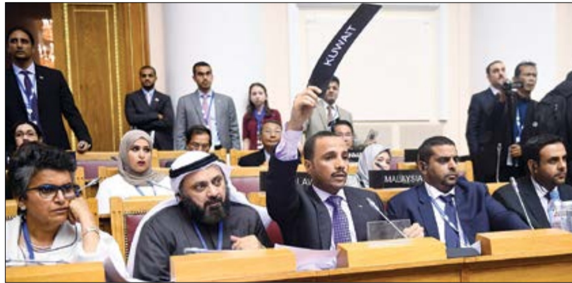
رئيس مجلس الأمة مرزوق الغانم يرفع اسم الكويت في جلسة الدورة الـ 137 للاتحاد البرلماني الدولي المنعقد حالياً في سان بطرسبورغ في روسيا