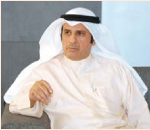
وزير العدل وزير الدولة لشؤون مجلس الأمة د.فالح العزب

وزير العدل خلال زيارته «الأنباء»: لا وجود لأجواء حلّ المجلس حالياً والحكومة «كتلة صلبة»