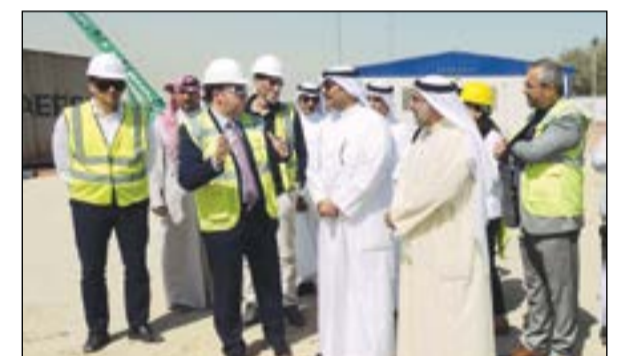
الشيخ أحمد المشعل خلال زيارته مشروع مبنى الركاب المساند (تي فور) في مطار الكويت الدولي

حثّ رئيس جهاز متابعة الأداء الحكومي الشيخ أحمد المشعل مسؤولي «الطيران المدني على بذل الجهد والمتابعة الحقيقية لمراحل تنفيذ مشروع مبنى الركاب المساند «تي فور» في مطار الكويت الدولي. وأكد المشعل خلال زيارة ميدانية للمشروع استعداد الجهاز لتذليل أي صعوبات أو عقبات تعوق إنجاز هذا المشروع الحيوي، تلافياً لحدوث أي تأخير يعرقل تسلمه في مواعده المحدد.