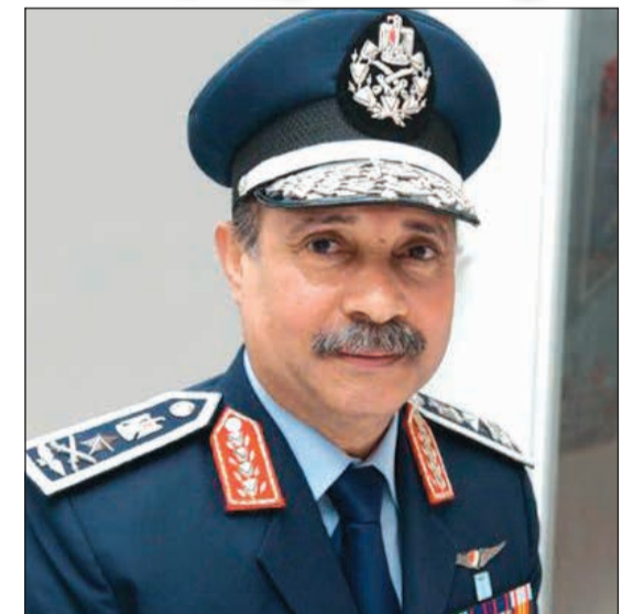
الفريق يونس المصري

العسكري المعاصر والتي كان من دروسها الاستفادة ضرورة التطوير والتحديث فيما يخص الفرد المقاتل والطائرات والمعدات والقواعد الجوية والمطارات والمنشآت الأخرى، وتسعى القوات الجوية كأحد الأفرع الرئيسية للقوات المسلحة باستمرار للتطوير لذلك تم وضع عدة خطط للتطوير من خلال عدة محاور رئيسية، تتمثل المحور الأول فيها بتطوير الفرد المقاتل بالداخل والخارج لحصوله على أحدث ما توصل إليه العلم في مجال تكنولوجيا الطيران، أما المحور الثاني فهو تطوير الطائرات والمعدات وأنظمة التسليح، والذي يتم من خلال تبديل طائرات وهليكوبتر ونظم تسليح من أحدث ما تم إنتاجه في هذا المجال، أما المحور الثالث فهو تنفيذ أعمال التطوير بالقواعد الجوية والمطارات من خلال وضع خطة شاملة لتطوير جميع القواعد الجوية والمطارات والوحدات الفنية والإدارية منذ 4 سنوات والتي نجني ثمارها هذه الأيام.