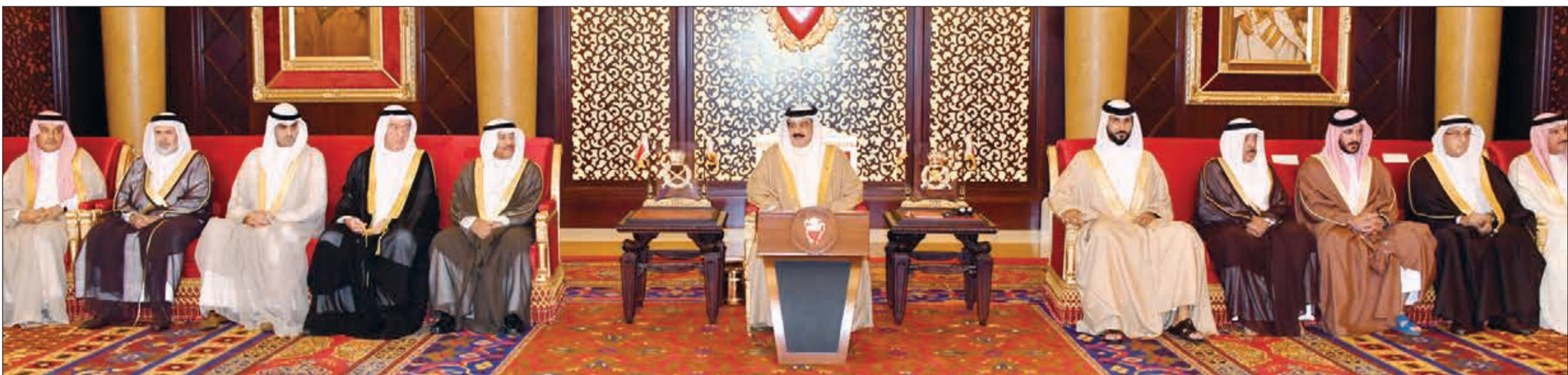
عامل البحرين خلال كلمته الترحيبية