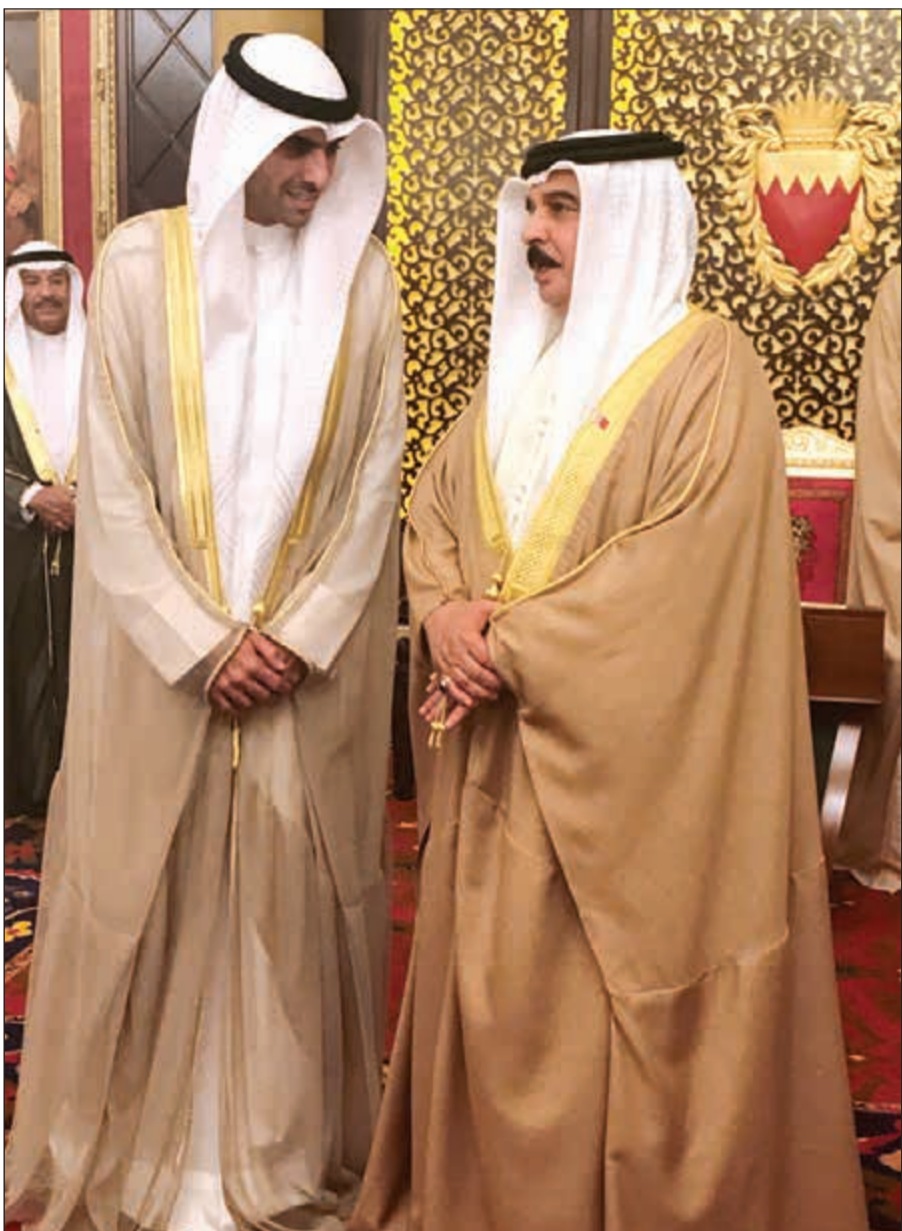
الملك حمد بن عيسى آل خليفة يتحدث مع بدر الخرافي أثناء التكريم في قصر الصخير

الخرافي: التكريم وسام على صدورنا جميعا في مجموعة زين