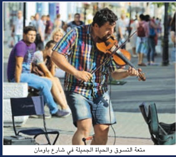
متعة التسوق والحياة الجميلة في شارع باومان