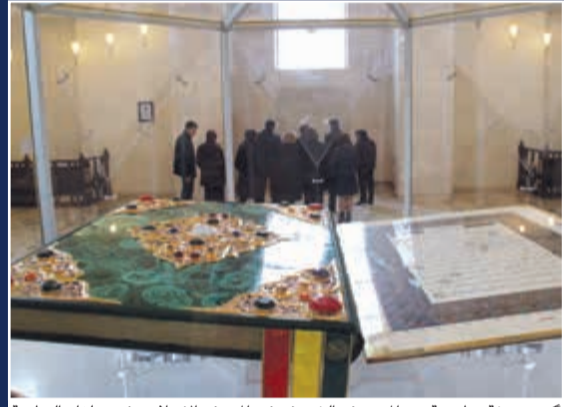
أكبر نسخة مطبوعة من المصحف الشريف في المتحف الإسلامي في بولغار العظيمة