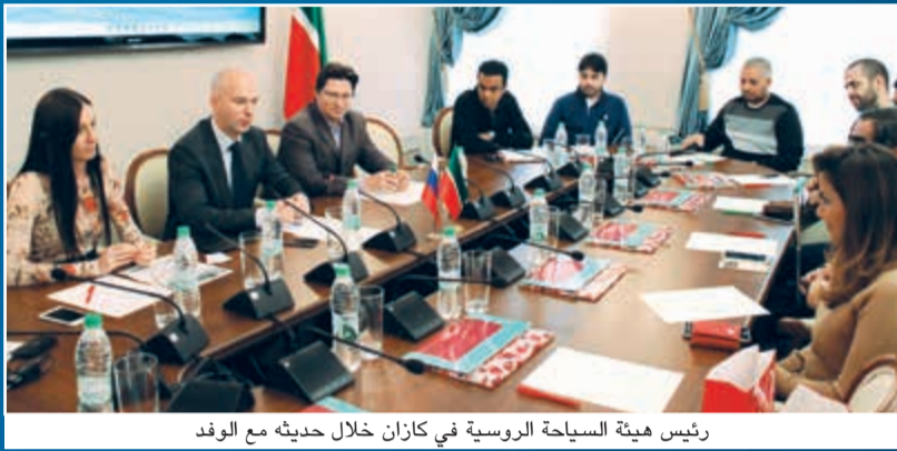
رئيس هيئة السياحة الروسية في كازان خلال حديثه مع الوفد