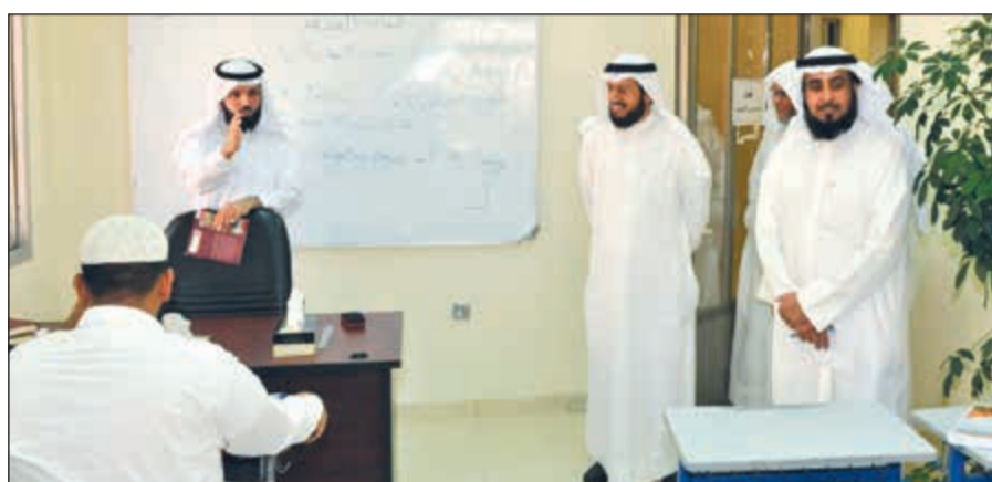
جولة داخل مراكز الدراسات الإسلامية

القائمين على هذه المراكز هم نخبة مختارة من الاشرافيين المتميزين والحاصلين على العديد من الدورات المتخصصة». المراكز الثقافية وعن المراكز الثقافية التابعة للإدارة، تحدث الجنفاوي قائلا: «يتبع ادارة الدراسات الإسلامية المركز الثقافي الإسلامي في منطقة مبارك الكبير والمركز الثقافي الإسلامي في منطقة سلوى، حيث يتم استقبال الطلاب من خارج الكويت لتأهيلهم علميا وشرعيا ودعويا حتى يكونوا نواة صالحة تنشر ما تعلموه في الكويت من العلوم الإسلامية الوسطية ومن فكر الاعتدال ونبي الغلو والتطرف». وعن القبول بهذه المراكز وعدد الدارسين بها، قال ان مجموع من درسوا بهذه المراكز يبلغ 1000 دارس خلال السنوات الماضية من مختلف دول العالم حيث يتم ترشيحهم من بلدانهم عبر وزارات الأوقاف او الهيئات والمراكز الإسلامية