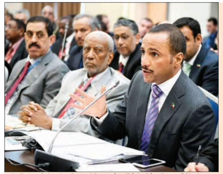
رئيس مجلس الأمة ورئيس الشعبة البرلمانية الكويتية مرزوق الغانم يتحدثان في الاجتماع التنسيقي للبرلمان الإسلامي في سان بطرسبورغ في روسيا على هامش فعاليات المؤتمر الـ 137 للاتحاد البرلماني الدولي

سامح عبد الحفيظ - سلطان العبدان بدر السهيل رفضت مؤسسة التأمينات الاجتماعية وهيئة العامة لشؤون ذوي الاحتياجات الخاصة توحيد مدة الخدمة التي يستحق وفقاً لها المعاش التقاعدي بين المرأة والرجل بالنسبة للمعاقين لأنه يتعارض مع الأصل العام في المعاشات التقاعدية التي تراعى فيها طبيعة ومسؤوليات المرأة وواجباتها الاجتماعية حيث يقرر لها مدد تقل عن الرجل لاستحقاق المعاش وكذلك سن تقل عنه في ضوء حالته الاجتماعية. جاء ذلك في سياق ردّها الذي تنشره «الانباء» على رغبة لجنة شؤون ذوي الاحتياجات الخاصة في معرفة وجهة النظر في الاقتراح بشأن الأشخاص ذوي الإعاقة المقدم من النائب مبارك الجحرف. وقالت المؤسسة في مذكرة تضمنت رأيها التالي: حول اقتراح تخفيض المدة المؤهلة لاستحقاق المعاش حسب درجة الإعاقة وتصنيفها والمساواة بين