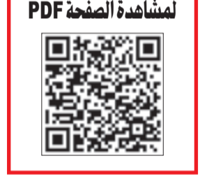
لمشاهدة الصفحة PDF

نكرت وزارة التجارة والصناعة أن تسليم المواد التموينية للمشمولين بها مستمر كالعادة من المنافذ المحددة لذلك، نافية وجود أي بدائل أخرى للمواد التموينية في الوقت الحالي. من جهة أخرى، يعززم وزير التجارة