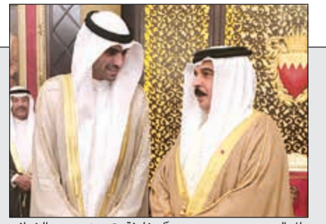
ملك البحرين حمد بن عيسى آل خليفة يتحدث مع بدر الخرافي أثناء التكريم في قصر الصخير

«بيتك» يفوز بجائزة غلوبال فاينانس كأفضل مزود للتمويل الإسلامي للمشاريع في العالم خلال 2017 29