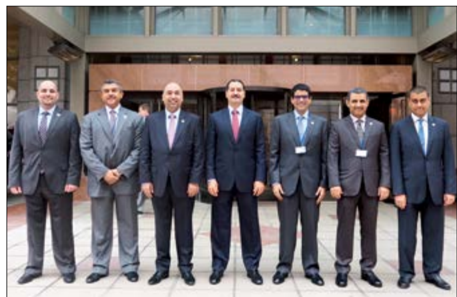
وفد «بيتك» المشارك في اجتماعات صندوق النقد

المشاركين يقومون بدور بارز وأساسي في صنع القرارات الاقتصادية ورسم ملامح السياسة المالية في بلدانهم. وتتضمن الاجتماعات السنوية اجتماعات اللجنة