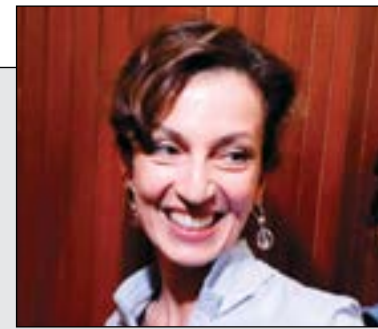
أودري أزولاي المدير العام الجديد لـ «اليونسكو»

فرنسا تفوز بمنصب المدير العام لـ «اليونسكو».. والأمير يهني ماركون 03 و 18