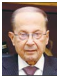
الرئيس ميشال عون

بيروت: ذكرت صحيفة «الجمهورية» اللبنانية أن الرئيس ميشال عون سيتوجه قريبا الى الكويت، بعدما أرجأ زيارته إلى طهران، والتي كانت مقررة منتصف هذا الشهر. مصدر لبناني رسمي، وردا على سؤال لـ «الأبناء» قال ان الموعد رهن الاتصالات الجارية بين البلدين، متوقعا إتمام الزيارة الى الكويت وطهران منتصف الشهر المقبل.