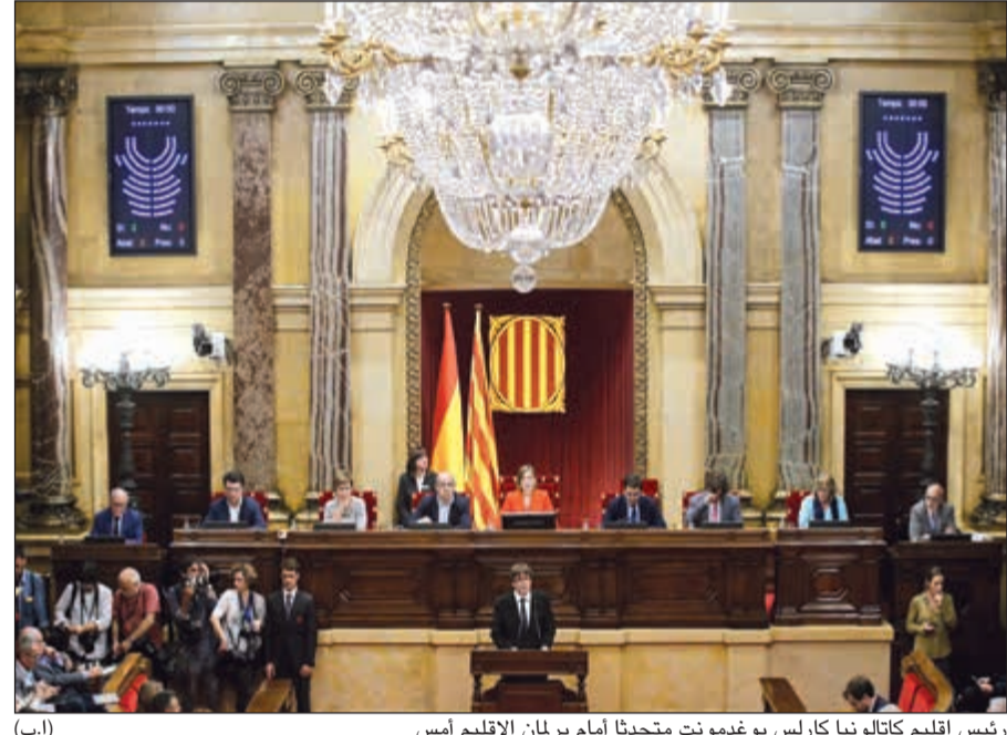
رئيس إقليم كاتالونيا كارلس بوغدمونت متحدًا أمام برلمان الإقليم أمس

عواصم - وكالات: أبقى رئيس إقليم كاتالونيا كارلس بوغدمونت الباب موارياً في خطابه أمام برلمان الإقليم أمس، وأعلن أن الاستفتاء الذي شهده مطلع الشهر الجاري «منحنا الحق في الاستقلال»، لكنه اقترح تعليق نتائج الاستفتاء لأسابيع لتشجيع الحوار مع مدريد.