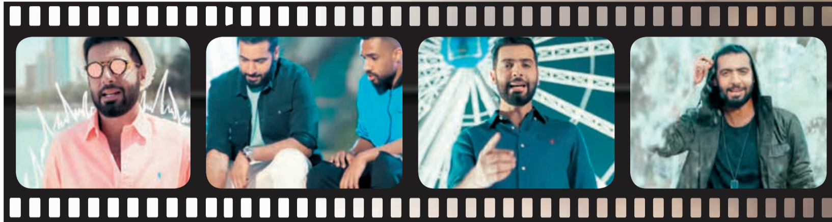
لقطات من كليب أغنية «صبي»

أكد أن نجاح ألبوم «تعال» يحمله مسؤولية كبيرة