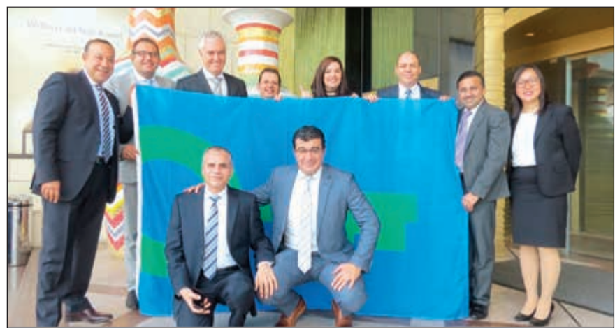
فريق سيمفوني ستايل في لحظة تذكارية بالمناسبة

وأغطية الأسرة بشكل يومي وغيرها من الإجراءات البسيطة التي تحمل أثراً كبيراً. وهكذا يواصل الفندق ترسيخ التزامه بتبني وتطبيق أفكار وأفعال تسهم في حماية البيئة والحفاظ على مواردها في إطار إستراتيجية المسؤولية المهنية الخاصة بالفندق ومبادرات برنامج المفتاح الأخضر في جميع أرجائه ومرافقه، ويبدل فريق العمل قصارى جهده لرسم ملامح مستقبل مشرق ومستدام تحت إشراف المدير العام ومشاركة جميع العاملين في الفندق.