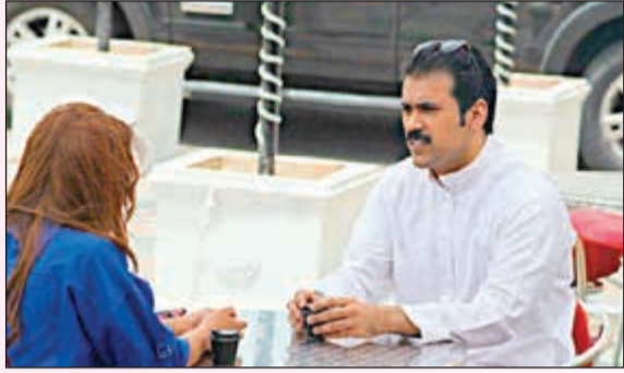
..وفي مسلسل «حرب القلوب»