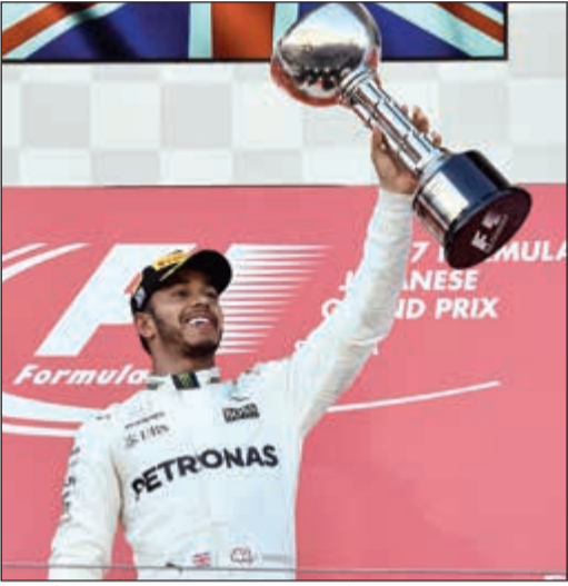
لويس هاميلتون يواصل تألقه في عالم الفورمولا 1 (إ.غ.ب)

أحرز سائق فريق مرسيدس البريطاني لويس هاميلتون أمس، لقب جائزة اليابان الكبرى، المرحلة السادسة عشرة من بطولة العالم للفورمولا 1، مستفيدا بشكل مثالي من انسحاب منافسه على صدارة الترتيب العام سائق فيراري الألماني سيباستيان فيتل. وتقدم هاميلتون على سائقي ريد بول، الهولندي ماكس فيرشتابن والاسرائيلي دانيال ريكباردو، بعدما اضطر فيتل الذي انطلق من المركز الثاني خلف البريطاني، للانسحاب في الملفات الأولى بسبب مشكلة في المحرك.