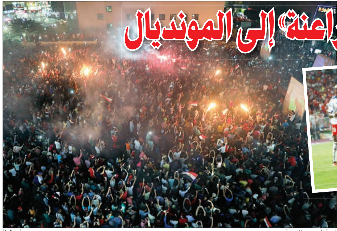
فرحة الجماهير المصرية

كرة خطيرة في عمق الدفاع إلى صالح جمعة ولكنها أهدرها بغرابية في يد الحارس. وفي الدقيقة 62، نجح محمد صلاح في التقدم بهدف من تمريرة أعادها بادبلا بالخطأ لينطلق النجم الذهبي ويسجل هدف التقدم ببراعة. وسجل البديل أرنولد بوكو في الدقيقة 87 من كرة عرضية. وحصل محمود تريتزيغيه على ركلة جزاء في الدقيقة 94 بعد عرقلة في منطقة الجزاء ليسجل صلاح هدف الفوز ويتأهل منتخب مصر للمونديال.