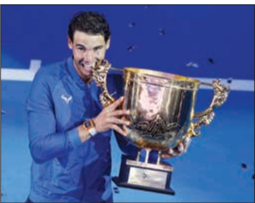
الإسباني نادال حقق لقبه الـ 75 في مسيرته

أحرز الإسباني رافيل نادال المصنف أول عالميا اللقب الـ 75 في مسيرته الاحترافية، بتتويجه أمس بلقب دورة بكين الدولية للتنس، وذلك عقب فوزه بسهولة على الأسترالي نيك كيربوس 2-6 و6-1.