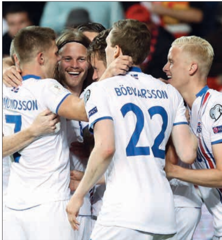
آيسلندا تبحث عن تأهلها لأول لكأس العالم

إلا أنه خسرها في الملحق أمام كرواتيا 2-0 آييا (تعادل سلبي نهابا). وسيكون لاعب خط وسط ريال مدريد الإسباني لوكا موريتش وزملاؤه في المنتخب الكرواتي، أمام مواجهة صعبة ضد أوكراينا على أرضها، مع وجوب الفوز في مباراتهم وانتظار تعثر آيسلندا على أرضها، لضمان بطاقة التأهل المباشر إلى كأس العالم. وفي باقي المباريات تلعب اليوم إسبانيا التي ضمنت تأهلها أمام الكيان الصهيوني، ألبانيا - إيطاليا، فنلندا - تركيا، مولدوفا - النمسا، صربيا - جورجيا، ويلز - إيرلندا، مقدونيا - ليشتنشتاين.