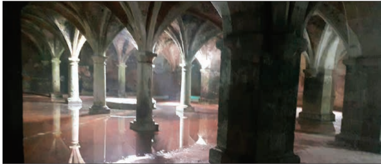
المسقاة البرتغالية .. حكاية تروى