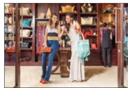
متعة التسوق في المنتجع