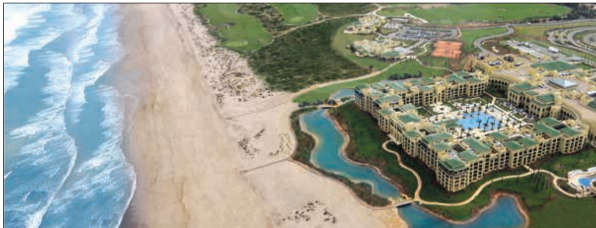
منتجع مازاكان مكان السحر والجمال