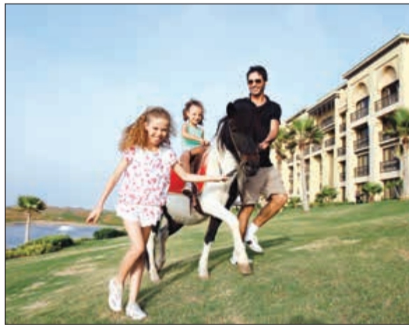
عالم الفروسية متوافر في المنتجع