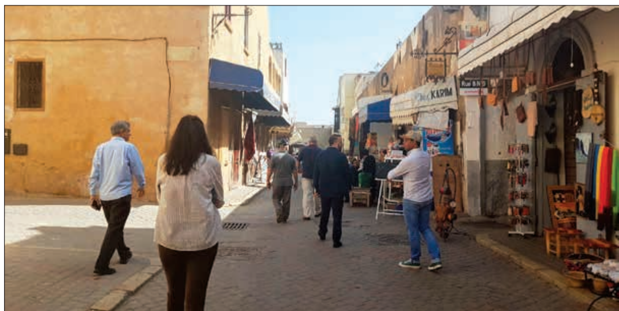
الحي البرتغالي يؤرخ لنمو 3 قرون