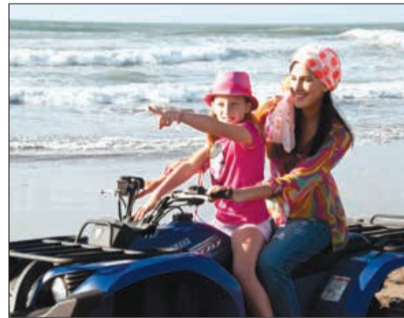
انشطة ترفيهية للكبارة والصغار

على بعد 90 كيلومترا جنوب مدينة الدار البيضاء، وعلى شاطئ المحيط الأطلسي، في واحة طبيعية على طول شاطئ الحوزية يقع المنتجع المغربي المذهل مازاكان، والذي وضع حجر أساسه الملك محمد السادس، رغبة منه في جعل مدينة الجديدة أحد الأقطاب السياحية التي تزخر بها المملكة.