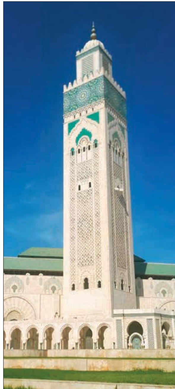
مئذنة مسجد الحسن الثاني الأعلى في العالم