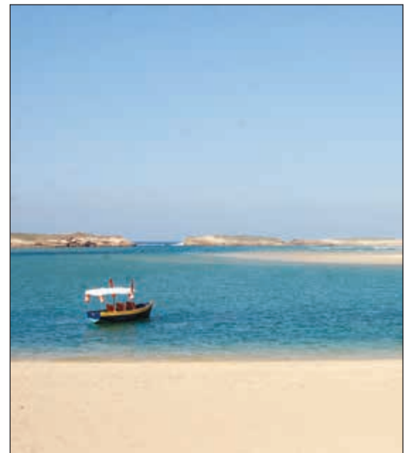
قارب صيد في ساحل الجديدة