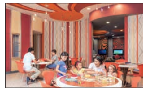
أطفالك في أيد أميتة