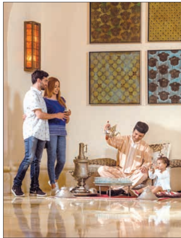
الشاي الأخضر .. تراث مغربي أصيل