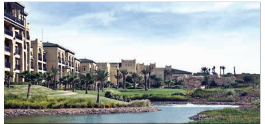
بحيرات وقنوات تطل عليها الغرف المميزة