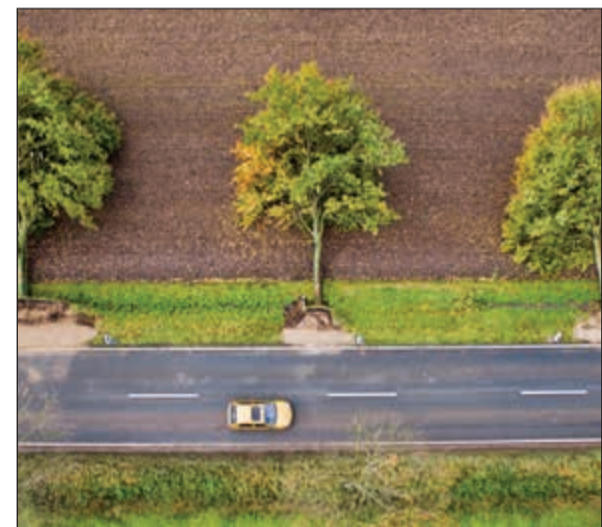
العاصفة تسببت في سقوط أشجار على الطرق الرئيسية

د.ب.أ: لاقى صحافية ألمانية بارزة حتفها جراء تعرضها لحادث، خلال عاصفة قوية اجتاحت شمالي ألمانيا. وأعلنت الخارجية الألمانية والجمعية الألمانية للسياسة الخارجية أن الصحافية وخبيرة الشؤون السياسية سيلكه تيمبل فارقت الحياة جراء تعرضها لحادث في العاصمة برلين. وبحسب بيانات قوات الإطفاء، فارقت تيمبل الحياة جراء سقوط شجرة عليها خلال إعصار «خافير» بعدما خرجت من سيارتها لإزالة أحد العوائق من الطريق. تجدر الإشارة إلى أن تيمبل رئيسة تحرير مجلة «إنترناشيونال بوليتيك» الألمانية وعضو مجلس إدارة في الجمعية الألمانية للسياسة الخارجية. وأشاد وزير الخارجية الألماني زيجمار جابرييل، في بيان، بمناقشات تيمبل ودقتها وفطنتها السياسية، مضيفاً أن تيمبل (54 عاماً) كانت شخصية غير عادية في المناقشات المتعلقة بالسياسة الخارجية، كما أنها ساهمت في إثراء المناقشات في وسائل الإعلام كعميلة وشريكة حوار في الأوساط السياسية والرأي العام. تجدر الإشارة إلى أن إعصار «خافير» أودى بحياة سبعة أشخاص على الأقل في ألمانيا.