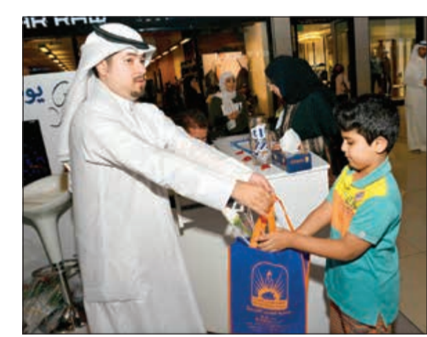
توزيع الهدايا على الأطفال

وحول الاحتفال بيوم المعلم العالمي بين العجمي أن هذا اليوم حدثته منظمة اليونسكو لتحتفل به الهيئات الحكومية والأهلية وإبراز دور المعلم ورسالته وتأثيره في المجتمعات ودوره الكبير في صناعة الأجيال، مشيراً إلى أننا نقيم هذه الاحتفالية بالتعاون مع مجمع الأقفيوز، حيث تم تخصيص ركن للجمعية زاره مجموعة من طلبة المدارس من خلال وفود نظمتها وزارة التربية إضافة إلى المعلمين والمعلمات وعدد من القيادات التربوية لتسجيل كلمة شكر وعرفان للمعلم، مشدداً على ضرورة أن تكون له نظرة مختلفة خاصة أن مهنة المعلم من أفضل المهن.