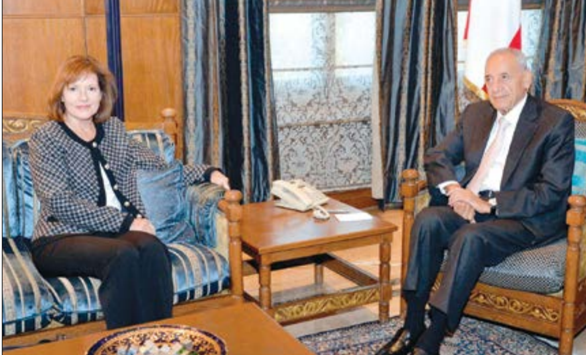
رئيس مجلس النواب نبيه بري مستقبلاً السفيرة الأميركية الزبائيت ريتشارد في عين التينة (محمود الطويل)