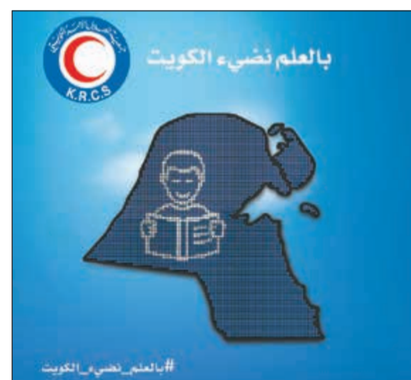
إعلان حملة بالعلم نضيء الكويت