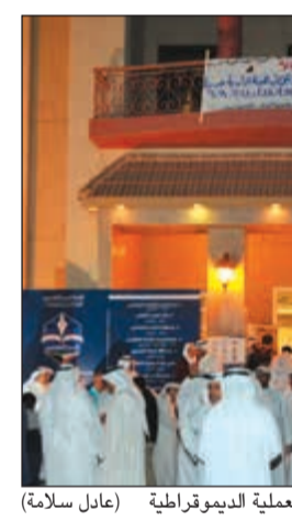
إقبال من أعضاء الجمعية على المشاركة في العملية الديمقراطية (عادل سلامة)