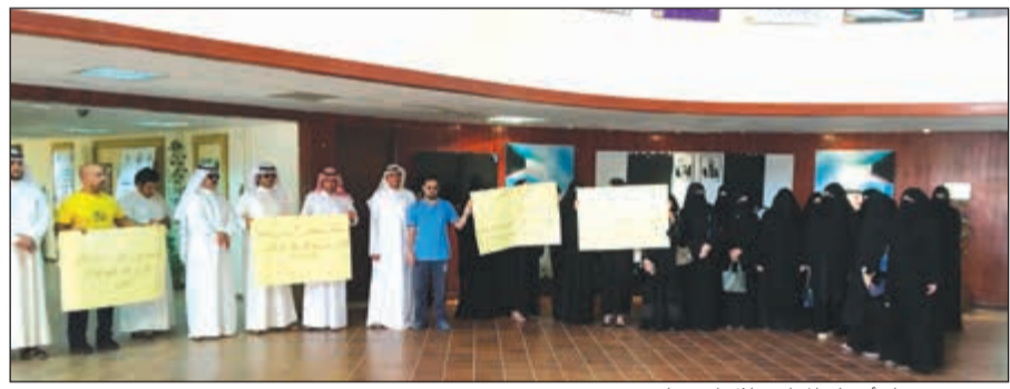
عدد من رؤساء أقسام المواد خلال اعتصامهم