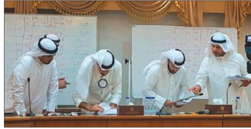
جانب من عملية فرز الأصوات