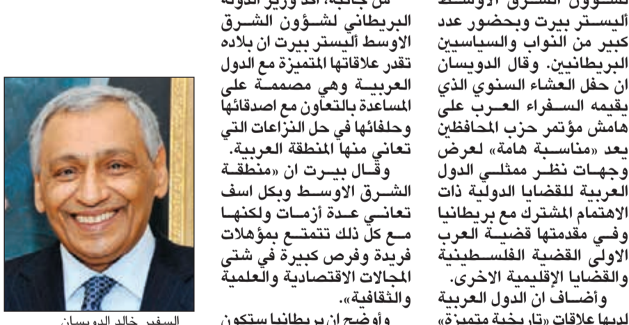
السفير خالد الدويسان

مانشستر (شمال بريطانيا) - كونا: أكد عميد السلك الدبلوماسي العربي والأجنبي سفيرنا لدى المملكة المتحدة خالد الدويسان أهمية دور بريطانيا في استقرار منطقة الشرق الأوسط والتي تمثل منطقة حيوية لجميع دول العالم من الناحية الجيو سياسية. جاء ذلك في تصريح على هامش حفل العشاء الذي أقامه السفير العرب اول من امس على شرف ممثل حزب المحافظين الحاكم وزير الدولة لشؤون الشرق الأوسط اليستر بيرت وبحضور عدد كبير من النواب والسياسيين البريطانيين. وقال الدويسان ان حفل العشاء السنوي الذي يقامه السفير العرب على هامش مؤتمر حزب المحافظين يعد «مناسبة هامة» لعرض وجهات نظر ممثلي الدول العربية للقضايا الدولية ذات الاهتمام المشترك مع بريطانيا وفي مقدمتها قضية العرب الاولى القضية الفلسطينية والقضايا الإقليمية الأخرى. وأضاف ان الدول العربية لديها علاقات «تاريخية متميزة»