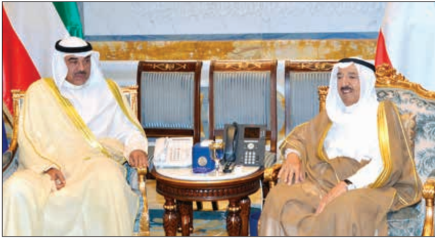
صاحب السمو الأمير الشيخ صباح الأحمد مستقبلاً الشيخ صباح الخالد

استقبل صاحب السمو الأمير الشيخ صباح الأحمد بقصر بيان صباح امس سمو ولي العهد الشيخ نواف الأحمد. كما استقبل سموه بقصر بيان صباح امس رئيس مجلس الوزراء بالإنيابة وزير الخارجية الشيخ صباح الخالد. واستقبل صاحب السمو الأمير الشيخ صباح الأحمد بقصر بيان صباح امس نائب رئيس مجلس الوزراء وزير الدفاع الشيخ محمد الخالد حيث قدم لسموه الشيخ أحمد المنصور وذلك بمناسبة تعيينه وكيلاً لوزارة الدفاع. وبعث صاحب السمو الأمير ببرقية تهنئة إلى جلالة الملك ليتسي الثالث ملك مملكة ليسوتو عبر فيها سموه عن خالص تهنائه بمناسبة العيد الوطني لبلادهم متمنياً لجلالته موفور الصحة والعافية وللبلد الصديق دوام التقدم والازدهار. وبعث سمو ولي العهد الشيخ نواف الأحمد ببرقية تهنئة إلى جلالة الملك ليتسي الثالث ملك مملكة ليسوتو ضمنها سموه خالص تهنائه بمناسبة العيد الوطني لبلادهم راجياً لجلالته موفور الصحة والعافية. كما بعث سمو رئيس مجلس الوزراء الشيخ جابر المبارك ببرقية تهنئة مماثلة.