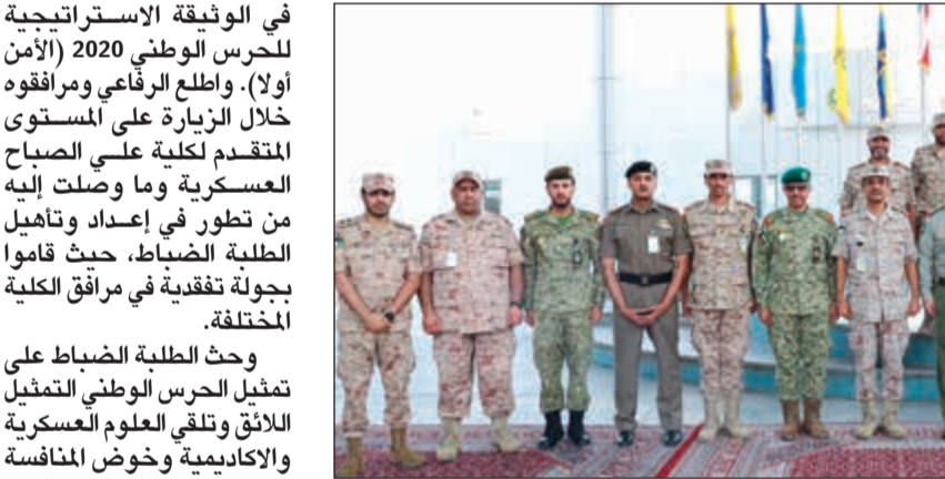
الفريق الركن م. هاشم الرفاعي خلال زيارته كلية علي الصباح العسكرية

في الوثيقة الاستراتيجية للحرس الوطني 2020 (الأمن أولا). واطلع الرفاعي ومرافقوه خلال الزيارة على المستوى المتقدم لكلية علي الصباح العسكرية وما وصلت إليه من تطور في إعداد وتأهيل الطلبة الضباط، حيث قاموا بجولة تفقدية في مرافق الكلية المختلفة. وحث الطلبة الضباط على تمثيل الحرس الوطني التمثيل اللائق وتلقي العلوم العسكرية والأكاديمية وحوض المنافسة على نيل مراكز الزيارة الأولى والالتزام بالضبط والربط العسكري. متمنياً لهم التوفيق والنجاح. وفي نهاية الزيارة تبادل وكيل الحرس الوطني الدروع التذكارية مع أمر كلية علي الصباح العسكرية.