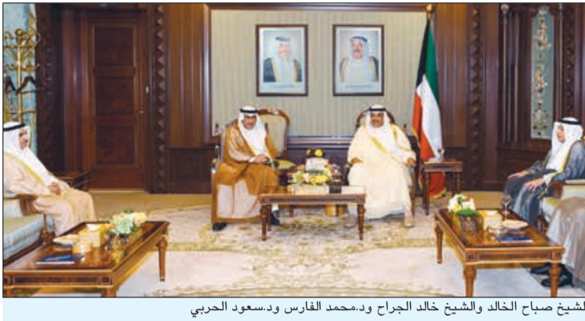
الشيخ صباح الخالد والشيخ خالد الجراح و د. محمد الفارس و د. سعود الحربي

يستقبل سفير خادم الحرمين الشريفين لدى الكويت د. عبدالعزيز الفايز المعزين بوفاء والدته رحمها الله يومي السبت والأحد المقبلين 7 و8 الجاري في دار سكنه بالمنطقة الدبلوماسية في مشرف.