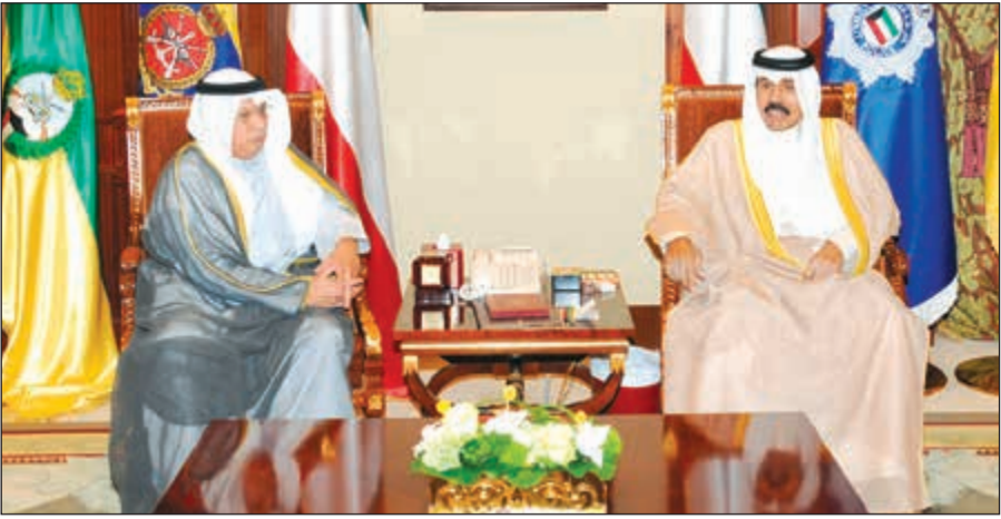
سمو ولي العهد الشيخ نواف الأحمد مستقبلاً الشيخ خالد الجراح

استقبل سمو ولي العهد الشيخ نواف الأحمد بقصر بيان صباح امس رئيس مجلس الوزراء بالإنيابة وزير الخارجية الشيخ صباح الخالد. كما استقبل سمو ولي العهد الشيخ نواف الأحمد بقصر بيان صباح امس نائب رئيس مجلس الوزراء وزير الدفاع الشيخ محمد الخالد، حيث قدم لسموه وزير الدفاع الشيخ أحمد المنصور وذلك بمناسبة تعيينه في منصبه الجديد. واستقبل سموه بقصر بيان صباح امس نائب رئيس مجلس الوزراء وزير الدفاع الشيخ خالد الجراح. كما استقبل سمو ولي العهد الشيخ نواف الأحمد بقصر بيان صباح امس نائب رئيس مجلس الوزراء وزير الدفاع الشيخ أحمد المنصور، وذلك بمناسبة تعيينه وكيلاً لوزارة الدفاع. واستقبل الخالد بحضور نائب رئيس مجلس الوزراء وزير التربية وزير التعليم العالي د. محمد الفارس، حيث قدم لسموه د. سعود الحربي وذلك بمناسبة فوزه بمنصب أمين عام المنظمة العربية للتربية والثقافة والعلوم (السكو).