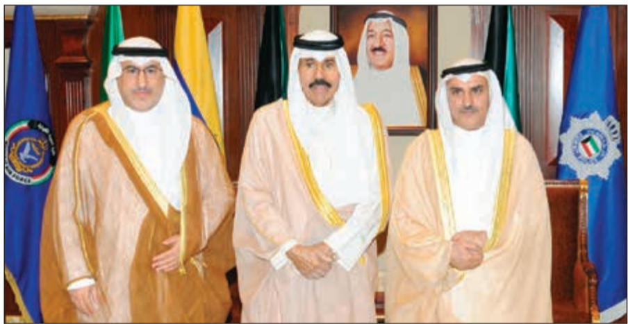
سمو ولي العهد الشيخ نواف الأحمد مستقبلاً د. محمد الفارس ود. سعود الحربي

استقبل سمو ولي العهد الشيخ نواف الأحمد بقصر بيان صباح امس رئيس مجلس الوزراء بالإنيابة وزير الخارجية الشيخ صباح الخالد. كما استقبل سمو ولي العهد الشيخ نواف الأحمد بقصر بيان صباح امس نائب رئيس مجلس الوزراء وزير الدفاع الشيخ محمد الخالد، حيث قدم لسموه وزير الدفاع الشيخ أحمد المنصور وذلك بمناسبة تعيينه في منصبه الجديد. واستقبل سموه بقصر بيان صباح امس نائب رئيس مجلس الوزراء وزير الدفاع الشيخ خالد الجراح. كما استقبل سمو ولي العهد الشيخ نواف الأحمد بقصر بيان صباح امس نائب رئيس مجلس الوزراء وزير الدفاع الشيخ أحمد المنصور، وذلك بمناسبة تعيينه وكيلاً لوزارة الدفاع. واستقبل الخالد بحضور نائب رئيس مجلس الوزراء وزير التربية وزير التعليم العالي د. محمد الفارس، حيث قدم لسموه د. سعود الحربي وذلك بمناسبة فوزه بمنصب أمين عام المنظمة العربية للتربية والثقافة والعلوم (السكو).