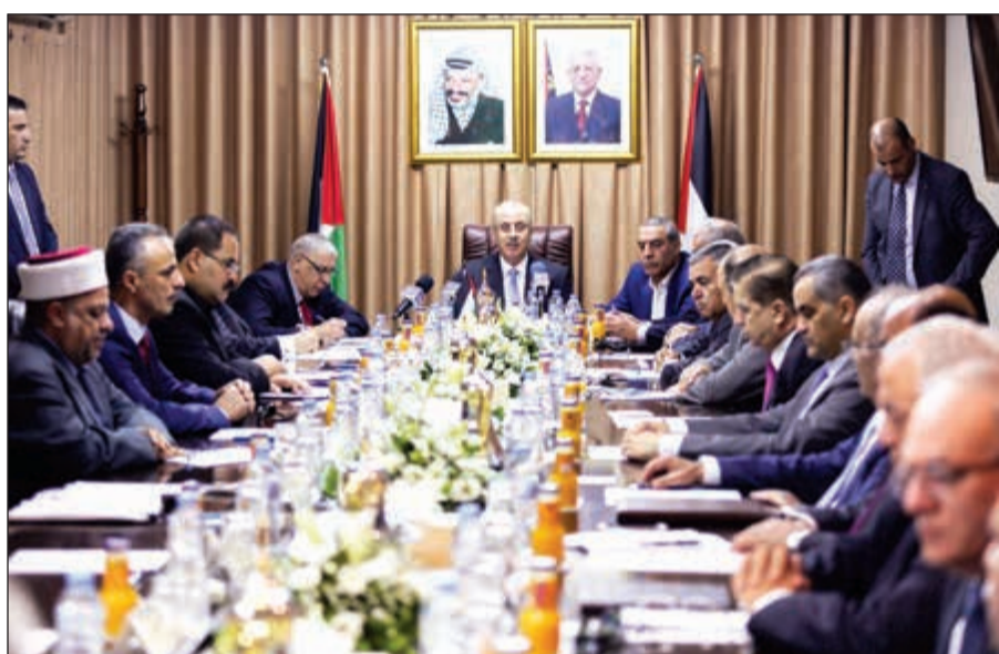
الاجتماع المشترك بين حكومة الوفاق الوطني الفلسطينية برئاسة رامى الحمدالله واللواء خالد فوزي والوفد المصري إلى غزة

غزة، في خطوة أولى على طريق إرساء عودة السلطة الفلسطينية المعترف بها دولياً إلى القطاع الخاضع لسيطرة حركة حماس منذ 2007. وقال الحمدالله عند افتتاح الجلسة: «نحن هنا لنطوي صفحة الانقسام إلى غير رجعة، ونعيد مشرونا الوطني إلى وجهته الصحيحة: إنهاء الاحتلال الإسرائيلي وإقامة الدولة وحل القضية الفلسطينية على أساس قواعد القانون الدولي والقرارات الأممية وكل الاتفاقيات والمواثيق ومبادئ الشرعية». وأعلن الناطق باسم الحكومة يوسف المحمود في مؤتمر صحفي عقب انتهاء الاجتماع أن الحكومة أجرت «مناقشة سريعة للملفات الكهربية والمياه والإعمار، وإن ملف الأمن والمعايير والموظفين سيتم بحثهم في القاهرة الأسبوع المقبل». وقال «الحكومة لا تمتلك عصا سحرية لحل مشاكل قطاع غزة ولكنها سوف تتنقل إلى قطاع غزة مجدداً». وأوضح أن اتفاق إنهاء الانقسام سيكون على 3 مراحل تتمثل في تشكيل لجان للبدء بالعمل على حل مشاكل المعابر والكهرباء والماء وملفات أخرى. وأضاف «لدينا إصرار على حل كل المسائل العالقة وصولاً لتحقيق المصالحة». ووصف وضع قطاع غزة بـ «الأساوي». واعتبرت حماس في بيان صحفي أن «ما حدث بالأمس واليوم هو خطوة كبيرة تكفلت بتسليم الحكومة مهامها كافة بشكل رسمي ودون أي معيقات، بما يجعلها مسؤولة مسؤولية كاملة عن الشؤون كافة في قطاع غزة وإدارتها وفق رؤية وطنية مسؤولة». وتابعت: «تباركت حركة حماس للشعب الفلسطيني قدوم حكومة الوفاق الوطني إلى قطاع غزة وتسلمها مهامها كاملة وغدما جلسنا الدورة بكامل هيئتها في أجواء نقاؤلية كبيرة». وخطوات المصالحة الحارية ثمرة لجهود مصرية خصوصاً.