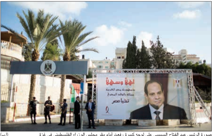
صورة الرئيس عبد الفتاح السيسي على لوحة كبيرة رفعت أمام مقر مجلس الوزراء الفلسطيني في غزة

أكد إسماعيل هنية أن حركة «حماس» لا تتدخل «مطلقاً في الشأن الداخلي المصري»، واستدرك: «الأمن القومي المصري مهم جداً لقضايا الأمة العربية والإسلامية، فضلاً عن القضية المحورية وهي قضية فلسطين». وأضاف: «خلال الشهور والفترة الماضية رسخنا قواعد وعلاقة استراتيجية مع مصر، وخاصة في العلاقات الثنائية والبعث الأمني والسياسي». ولفت إلى أن «قوى الأمن الفلسطينية تقوم بإجراءات كبيرة جداً في منطقة الحدود بين غزة ومصر، ومنطقة الأنفاق ومتابعة أصحاب الفكر المنحرف». وقال إن الفلسطينيين «لا يريدون لمصر إلا كل الخير، وإنه لا يمكن أن يأتي لمصر من