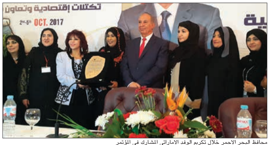
محافظ البحر الأحمر خلال تكريم الوفد الاماراتي المشارك في المؤتمر