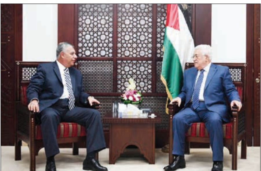
الرئيس محمود عباس مستقبلاً رئيس المخابرات المصرية اللواء خالد فوزي

الغزة، في خطوة أولى على طريق إرساء عودة السلطة الفلسطينية المعترف بها دولياً إلى القطاع الخاضع لسيطرة حركة حماس منذ 2007. وقال الحمدالله عند افتتاح الجلسة: «نحن هنا لنطوي صفحة الانقسام إلى غير رجعة، ونعيد مشرونا الوطني إلى وجهته الصحيحة: إنهاء الاحتلال الإسرائيلي وإقامة الدولة وحل القضية الفلسطينية على أساس قواعد القانون الدولي والقرارات الأممية وكل الاتفاقيات والمواثيق ومبادئ الشرعية». وأعلن الناطق باسم الحكومة يوسف المحمود في مؤتمر صحفي عقب انتهاء الاجتماع أن الحكومة أجرت «مناقشة سريعة للملفات الكهربية والمياه والإعمار، وإن ملف الأمن والمعايير والموظفين سيتم بحثهم في القاهرة الأسبوع المقبل». وقال «الحكومة لا تمتلك عصا سحرية لحل مشاكل قطاع غزة ولكنها سوف تتنقل إلى قطاع غزة مجدداً». وأوضح أن اتفاق إنهاء الانقسام سيكون على 3 مراحل تتمثل في تشكيل لجان للبدء بالعمل على حل مشاكل المعابر والكهرباء والماء وملفات أخرى. وأضاف «لدينا إصرار على حل كل المسائل العالقة وصولاً لتحقيق المصالحة». ووصف وضع قطاع غزة بـ «الأساوي». واعتبرت حماس في بيان صحفي أن «ما حدث بالأمس واليوم هو خطوة كبيرة تكفلت بتسليم الحكومة مهامها كافة بشكل رسمي ودون أي معيقات، بما يجعلها مسؤولة مسؤولية كاملة عن الشؤون كافة في قطاع غزة وإدارتها وفق رؤية وطنية مسؤولة». وتابعت: «تباركت حركة حماس للشعب الفلسطيني قدوم حكومة الوفاق الوطني إلى قطاع غزة وتسلمها مهامها كاملة وغدما جلسنا الدورة بكامل هيئتها في أجواء نقاؤلية كبيرة». وخطوات المصالحة الحارية ثمرة لجهود مصرية خصوصاً.