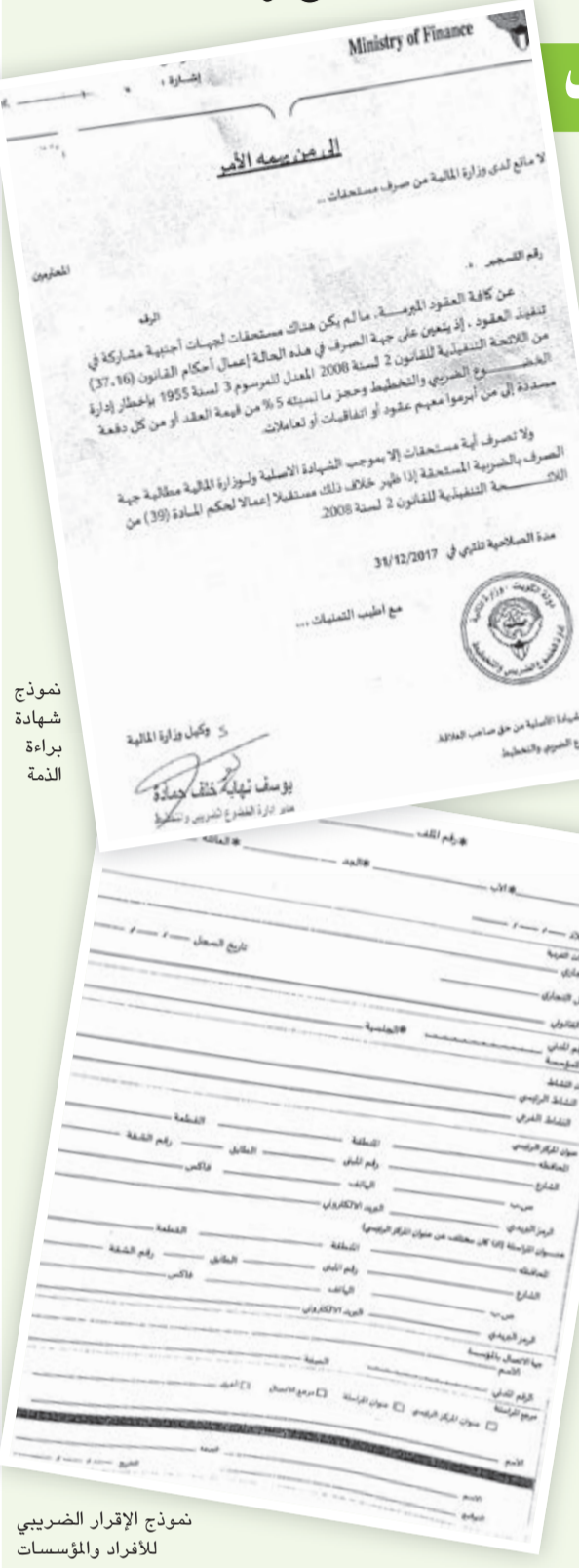
نموذج شهادة براءة الذمة

9 - كتاب تعهد الشركة بأسماء مقولين الباطن إذا وجد. وتستهدف الحكومة الكويتية زيادة إيرادات الضرائب بما يساعد على مواجهة عجز الموازنة الذي عانى منه الاقتصاد الكويتي في السنوات الأخيرة وبرزت تلك المصادر ضريبة الدخل إضافة إلى سعي الحكومة الكويتية لاستنباط اوعية ضريبية جديدة مثل ضريبة القيمة المضافة والضريبة الانتقائية والتي تستهدف إيرادات تتخطى مليار دينار ما سيساهم بشدة في معالجة العجز بعيداً عن الاعتماد على إيرادات النفط. وتضع الحكومة الكويتية خطة تنمية اقتصادية شاملة تعتمد على قطاعات غير نفطية وذلك في ظل تذبذب أسعار النفط خلال السنوات الماضية تقوم على خريطة مشروعات عملاقة في كافة القطاعات الاقتصادية تمتد حتى 2035 وأبرز تلك المشروعات التنموية المصفاة الرابعة ومشروع القودس البيئي ومستشفى جابر ومدينة الحرير وجسر بوبيان وميناء مبارك وغيرها من المشاريع، فضلاً عن دعوة صندوق النقد الدولي للكويت لفرص ضريبة الدخل على الشركات المحلية، وإدخال الرسوم على مراحل وإعادة النظر بسياسة الدعم، خاصة أن الكويت لن تتمكن من الاستمرار في النموذج الحالي للنمو لوقت طويل - بحسب تقرير صندوق النقد الدولي - وسط توقعات بضعف سوق النقد لمستويات حرجة بحلول 2017.