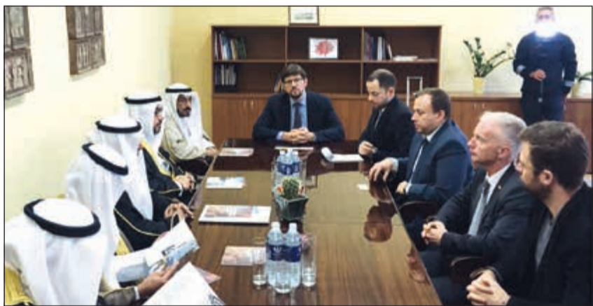
وفد الصداقة البرلمانية الثانية خلال مباحثاته مع وزير الخارجية الليتواني

والاقتصادية والسياحية، مؤكدين أهمية دعم عملية إرساء السلم والأمن والاستقرار في جميع أقاليم العالم.