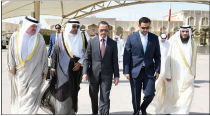
رئيس مجلس الأمة مرزوق الغانم لدى مغادرته البلاد إلى الولايات المتحدة الأمريكية

رئيس الاتحاد البرلماني الدولي صابر تشوهردي لتتسويق المواقف وتبادل الآراء ووجهات النظر قبيل مؤتمر الاتحاد المزمع عقده في مدينة سان بطرسبرغ الروسية في منتصف الشهر الجاري.