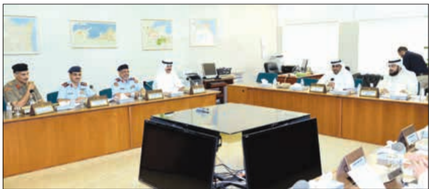
نائب رئيس الوزراء ووزير الدفاع الشيخ محمد خالد مؤسسا دمجنا الحريش وراكان النصف خلال اجتماع اللجنة

مستمرة في بقية المحاور، وسينم الاجتماع غداً مع ديوان الخدمة لاستكمال عملها.