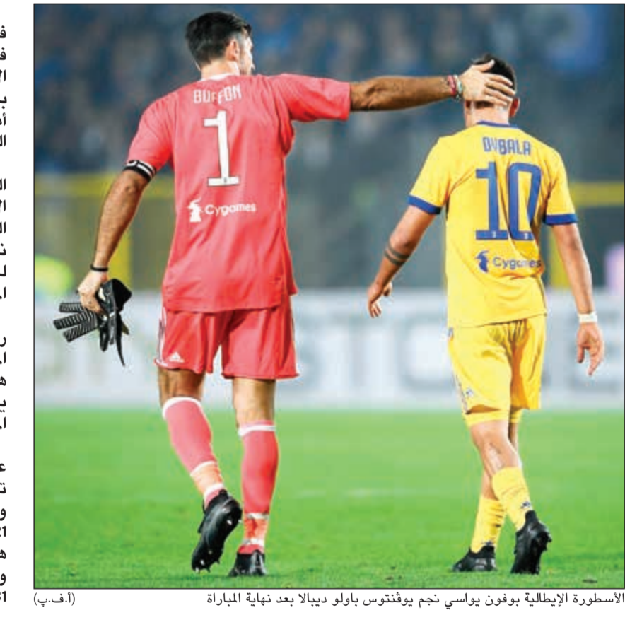
الأسطورة الإيطالية بوفون يواسي نجم يوفنتوس باولو ديبالا بعد نهاية المباراة (أ.ف.ب)

أهدر يوفنتوس أول نقطتين، في حملته للدفاع عن لقبه في مسيرته ببطولة الدوري الإيطالي لكرة القدم هذا الموسم، بعدما سقط في فخ التعادل 2-2 أمام ضيفه أتالانتا في المرحلة السابعة للمنافسة أول من امس. وارتفع رصيد يوفنتوس، الفائز باللقب في المواسم الستة الأخيرة، إلى 19 نقطة في المركز الثاني، بفارق نقطتين خلف نابولي، الذي انفرد بالصدارة للمرة الأولى في البطولة هذا الموسم. وفي المقابل، رفع أتالانتا رصيده إلى تسع نقاط في المركز الحادي عشر، علماً أن هذا هو التعادل الثالث الذي يحققه الفريق في المنافسة في الموسم الحالي. وعجز يوفنتوس عن الحفاظ على تقدمه بهدفين نظيفين حملاً توقيع فيديريكو بيرنارديسكي وغونزالو هيغواين في الدقيقتين 21 و24، بعدما أحرز أتالانتا هدفين عن طريق ماتيا كالدارا وبريان كريستانتى في الدقيقتين 31 و67.