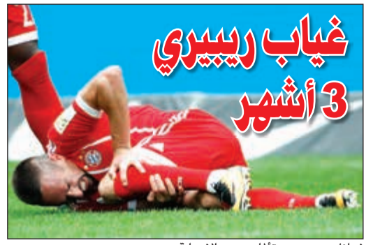
فرانك ريبيري متألمًا بسبب الإصابة

أيقونة النادي الملكي إيسكو يتجاوز لاعب إسبانيول سيرجي دارديو