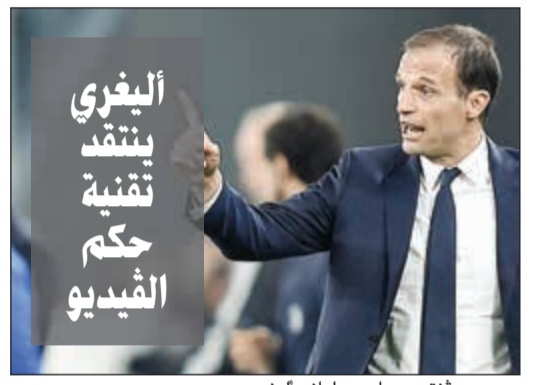
مدرب يوفنتوس ماسيميليانو ألغيري

يواجه الفرنسي فرانك ريبيري لاعب وسط بايرن ميونخ بطل ألمانيا في الموسم الخمسة الماضية احتمال الغياب لمدة ثلاثة أشهر بسبب تعرضه الى تمزق في أحد أربطة الركبة، حسب ما ذكرت شبكة سكاى. وخرج ريبيري في الدقيقة 62 من المباراة التي تعادل فيها بايرن مع هرتا برلين 2-2 بسبب إصابة قوية تعرض لها دون احتكاك بأحد، وكان بايرن يخوض المباراة بإشراف لاعبه السابق الفرنسي ويلي سانويل بعد إقالة المدرب الإيطالي كارلو أنشيلوتي عقب الخسارة القاسية أمام باريس سان جرمان الفرنسي 3-0 الأربعاء الماضي في دوري أبطال أوروبا. وأشار تقرير لسكاى الى ان ريبيري (34 عامًا) تعرض الى تمزق في أحد أربطة ركبته اليسرى وأنه سيستعد لفترة تتراوح بين شهرين وثلاثة أشهر، لكنها أكدت انه لن يخضع الى عملية جراحية. وتشكل الإصابة ضربة للاعب الفرنسي، خاصة أن عقده مع النادي ينتهي في آخر الموسم. ويفتقد بايرن قائده الحارس مانويل نوير ايضا حتى يناير بسبب كسر في القدم. وذكرت تقارير صحافية أن توماس توخل مدرب دورتموند السابق ويوليان ناغلسمان مدرب هوفنهايم هما المرشحان الأبرز لخلافة أنشيلوتي.