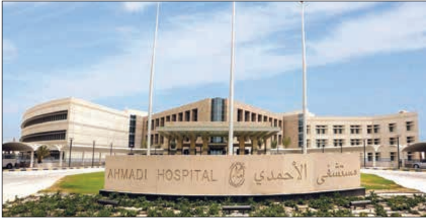
مستشفى نفط الكويت في الأحمدى يخدم العاملين في النفط وأسره