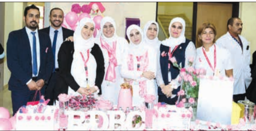
أحد الأجنحة التوعوية

وأكدت ان ابواب المركز مفتوحة لأي استفسار خاصة بعيدا التشخيص السريع الذي يتم بالكامل على مدار اسبوع واحد فقط ما بين تحويل المريضة وصولا للتشخيص. وأشارت إلى ان الفعالية تمتد على مدار الشهر حيث الانطلاقة اليوم كانت من مركز فيصل بن عيسى عبر بونانا ارشادية توعوية مع تواجد أطباء ومتخصصين لاعطاء كل النصائح وستستمر بمراكز ومجمعات للوصول للجمهور بأماكن لتجمع ومنها برج الحمراء ومجمع 360 وتقديم محاضرات بمركز فيصل السلطان.