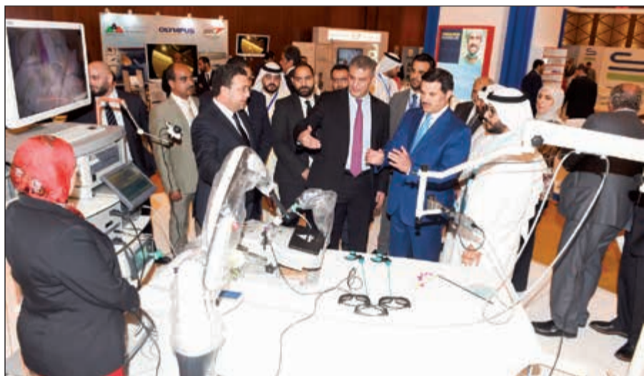
جولة داخل المعرض المصاحب

وأكد أن المؤتمر يهدف إلى تدريب الأطباء الجدد على طرق التعامل مع الحالات المرضية المختلفة، ومن ثم تطوير مهاراتهم وتعزيز خبراتهم في هذا المجال.