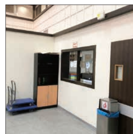
مستشفى ابن سينا

على أصحاب الدخل المحدود، مؤكداً أن الأسعار الجديدة تفوق طاقاتهم. وقد أكد أغلب المراجعين من الوافدين أن الزيادة الجديدة ظلمت الكثير من المرضى الذين يحتاجون إلى رعاية طبية شديدة، وأن الكثيرين سيفكرون كثيراً حتى قبل مراجعة المركز الصحي لأن المعروف أن الأطباء الموجودين هناك هم أطباء عامون وغير متخصصين ولن يفيدوهم حتى بتحديد المرض والتحويل إلى العيادات التخصصية لأنهم لا يمكنون مبالغ كبيرة لمراجعة العيادات.