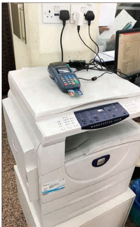
بدء استخدام «الكي نت» لتحصيل الرسوم

على أصحاب الدخل المحدود، مؤكداً أن الأسعار الجديدة تفوق طاقاتهم. وقد أكد أغلب المراجعين من الوافدين أن الزيادة الجديدة ظلمت الكثير من المرضى الذين يحتاجون إلى رعاية طبية شديدة، وأن الكثيرين سيفكرون كثيراً حتى قبل مراجعة المركز الصحي لأن المعروف أن الأطباء الموجودين هناك هم أطباء عامون وغير متخصصين ولن يفيدوهم حتى بتحديد المرض والتحويل إلى العيادات التخصصية لأنهم لا يمكنون مبالغ كبيرة لمراجعة العيادات.