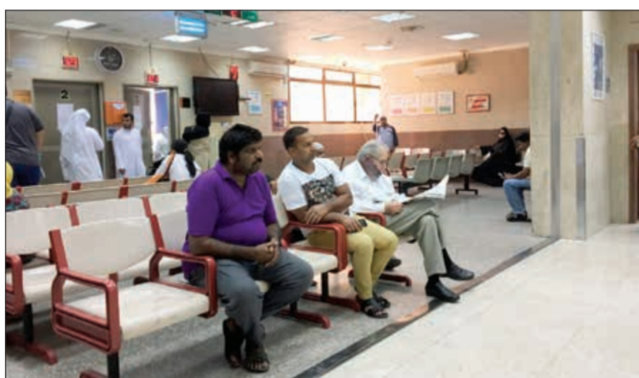
طوارئ مستشفى مبارك

وقد أقيم الحفل برعاية ومساهمة فعالة من شركة المعوشرجي للتجهيزات الغذائية والشركة الكويتية للألبان ومؤسسة الكويت للتقدم العلمي - المركز العلمي وماجيك بلانيت وقام العجمي بتسليم شهادات التفوق والهدايا على الطلبة أبناء أعضاء الجمعية العمومية وبمشاركة وحضور أعضاء الجمعية العمومية وأسرهم والذي كان لها الأثر الطيب في نفوس الحضور وشمل برنامج الاحتفال على شخصيات للأطفال والعديد من الأنشطة وقدمت العديد من المسابقات وقدمت هدايا للطلاب.