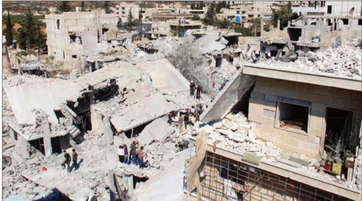
عناصر من الدفاع المدني يبحثون عن ناجين وضحايا تحت انقاض المنازل المدمرة بعد الغارات على ارمناز بريف ادلب