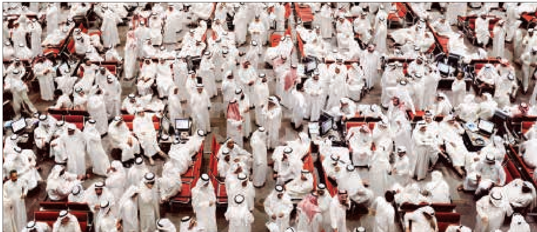
بورصة الكويت في انتظار عودة العصر الذهبي بعد الترقية