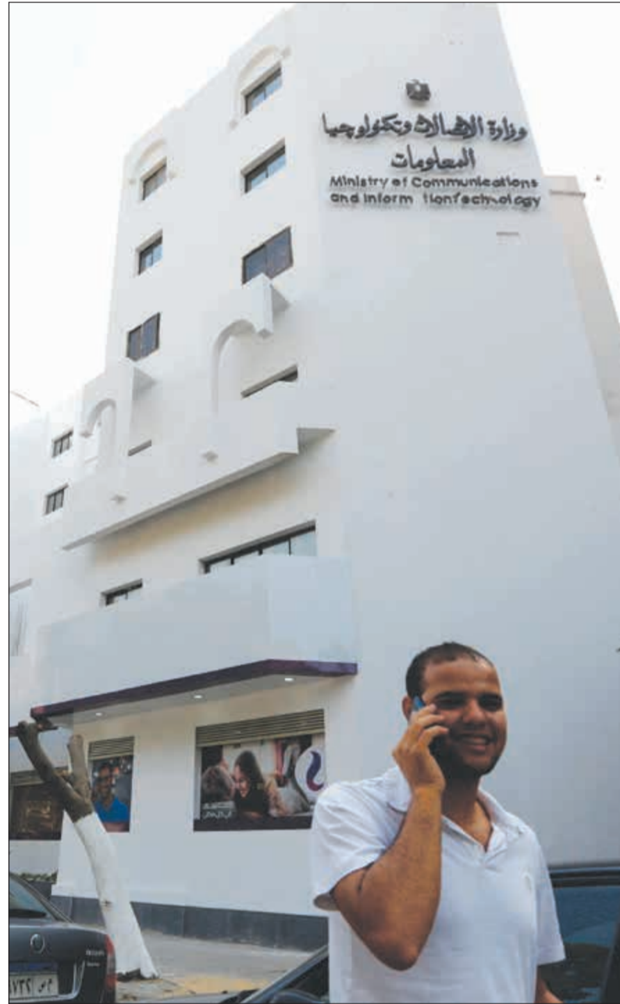
مفاجأة جديدة برفع أسعار كروت شحن الاتصال

وعودة الى صندوق النقد الدولي فقد اضاف ان برنامج الإصلاح الذي تنتهجه الحكومة المصرية من إصلاحات شملت إعادة هيكلة منظومة دعم الطاقة، وضبط الأجور، وإقرار ضريبة القيمة المضافة، وقانون الاستثمار الجديد، هو برنامج محلي مصحوب بمساعدة من صندوق النقد الدولي. ويسؤاله عن المراجعة الثانية لآداء الاقتصاد المصري في أكتوبر المقبل، أوضح الصندوق أن كل مراجعة تضع في الاعتبار آخر التطورات الاقتصادية ورؤية لسير الاتفاق والبرنامج خلال المدى المتوسط، مشيرًا إلى أن صرف كل شريحة يتم بعد إتمام المراجعات النصف سنوية. وأشار بيان «المركزي» إلى أن المعدل السنوي للتضخم العام في أغسطس انخفض إلى 31,9٪ من 33٪ في يوليو في حين تراجع المعدل الشهري للتضخم من 3,2٪ إلى 1,1٪، وأضاف أن معدل النمو السنوي للناجئ المحلي الإجمالي الحقيقي في النصف الأول من العام بلغ 4,6٪، كما أظهر البيان تراجع معدل البطالة إلى 12٪ في النصف الأول من 2017 وهو أدنى معدل منذ النصف الأول 2012.