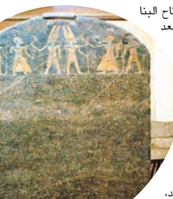
لوحة النصر لمرنبتاح

وأضاف أن «الهلالى أستاذ فقه مقارن وليس آثار، وما قاله ليس مجالاً للفتوى، فلم الأثرىا عميق ويعتمد على دراسات أثرية وتاريخية وحفريات وبعثات تقوم بالبحث، وليس مجرد معلومات نأخذها من الكتب والمراجع».