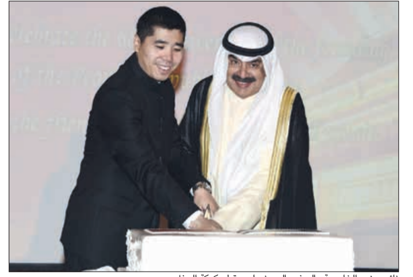
نائب وزير الخارجية والسفير الصيني لدى قطع كعكة الحفل

خلال حفل أقامته السفارة بمناسبة الذكرى الـ 68 على تأسيس جمهورية الصين الشعبية