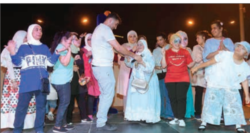
جانب من الأنشطة الترفيهية المحببة للأطفال

التدريب والعمل على دمج الأشخاص من ذوي الإعاقة في المجتمع فيودون الدور المطلوب منهم بالتأثير والتأثر فيه، لافتا إلى أن تلك الفعاليات المتنوعة والمختلفة التي أقيمت خلال هذا الصيف تأتي ضمن خطوات واليات عمل منظمة يقوم بها المركز بهدف تعزيز مفاهيم الدمج المجتمعي للأشخاص من ذوي الإعاقة مع أقرانهم، والعمل على تنمية مهاراتهم الإبداعية وفقا للأساليب العلمية مما يسهم بشكل كبير في إشغال أوقات فراغهم. كما توجه رعد بجزييل الشكر والتقدير إلى بنك الخليج على رعايته الكريمة لهذا الحدث، متوجها أيضا بجزييل الشكر إلى الشركات المساهمة في الحفل وهي: إدارة معرض الكويت الدولي مكدونالدز، شركة فانتسي وورلد، مجموعة الولاء التطوعية، مجموعة شباب النيل.