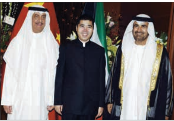
السفير الإماراتي رحمة الزعابي يبارك للسفير الصيني