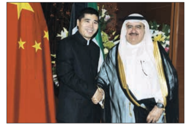
ثابت المهنا مهنتا السفير الصيني