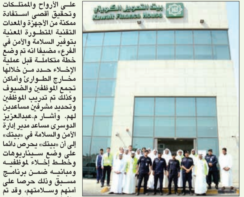
مسؤولو «بيتك» ووزارة الداخلية أمام الفرع