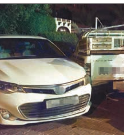
من حادث «النسيم»

نقل رجال الأمن شبابا إلى مخفر تيماء بعد إتلاف 4 سيارات اصطدم بها بمركبته دون قصد وجار التحقيق في الواقعة. وقال مصدر أمني أن بلاغا ورد إلى غرفة عمليات الداخلية عن وقوع حادث إصابة واصطدام في منطقة النسيم فجر امس وتوجه رجال الأمن والإسعاف إلى الموقع، حيث تبين ان الشاب مواطن وبحالة غير طبيعية، وان الحادث تسبب في إتلاف 4 مركبات دون وقوع أي إصابات.