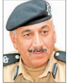
اللواء فهد الشويح

علمت «الأنباء» ان وكيل وزارة الداخلية المساعد لشؤون المرور بالإنيابة اللواء فهد الشويح أصدر تعليماته إلى جميع إدارات المرور في محافظات الكويت الست تتضمن تفعيل القانون بشأن المركبات التي يتم سحب لوحاتها لمدة 15 يوماً، خاصة تلك التي يتم تحرير مخالفات لها، وسحب لوحاتها جراء