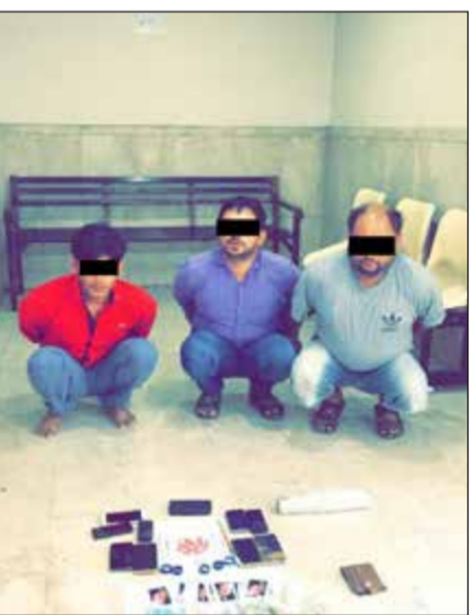
المقارون في قبضة أمن الفروانية

تتجه وزارة الداخلية، ممثلة بقطاع مكافحة المخدرات، إلى إبعاد 3 وأفدين مقامرین أحيلاؤها لحياسة مواد مخدرة، ويأتي التوجه بعد ان أحيلاؤها إلى القطاع من قبل أمن الجلب. وبحسب مصدر أمني، فإن دورية رصدت أشخاصاً جالسین في ساحة ترابية، وعند مشاهدتهم للدورية لأذوا بالفرار جريا على الأقدام، وتمت ملاحقتهم جريا وتم ضبطهم، وعند الاستعلام عنهم تبين أن الأول مطلوب إلقاء قبض إلى الإدارة العامة لمكافحة المخدرات وانتهاء إقامة، وعند التحفظ عليهم والرجوع إلى المكان الذي لأذوا بالفرار منه، تمت مشاهدة كيس بلاستيكي صغير أزرق اللون بداخله حبوب حمراء يشتبه بأنها مخدرة وبوردرة بيضاء اللون داخل زجاجة مياه معدنية ويشتهه بأنها مخدرة ومبلغ مالي 152 ديناراً كلها ملقاة على الأرض وأوراق مرقمة لألعاب الورق (الجنجفة).