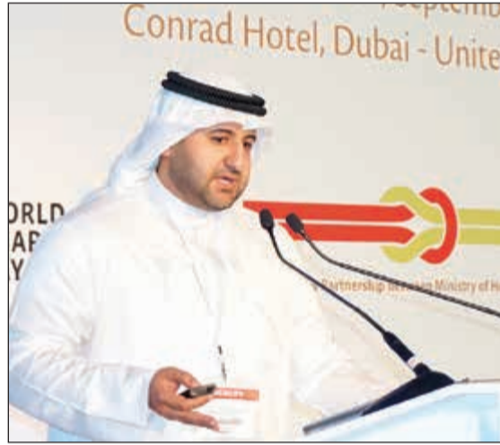
المشعل متحدثاً أمام المنتدى