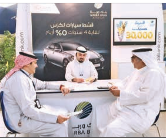
جناح البنك في المبنى الرئيسي للخطوط الكويتية

تأتي مشاركة بنك وربة في هذه الفعاليات تأكيداً على التزامه الدائم تجاه عملائه وجميع شرائح المجتمع بالتواجد في مختلف المؤسسات والهيئات في الكويت، للتعريف عن منتجاته وخدماته الحديثة أكثر قرباً منهم وللعمل على تلبية كافة احتياجاتهم وتطلعاتهم. هذا، ويحرص بنك وربة دوماً على منح عملائه كل ما هو جديد وفريد من المنتجات والخدمات المصرفية الحديثة بغية نيل رضاهم وتخطي توقعاتهم، كما يسعى بنك وربة إلى تقديم أفضل الحلول التمويلية التي تغطي كل احتياجات العميل بما يحقق النفع الأكبر للعملاء.