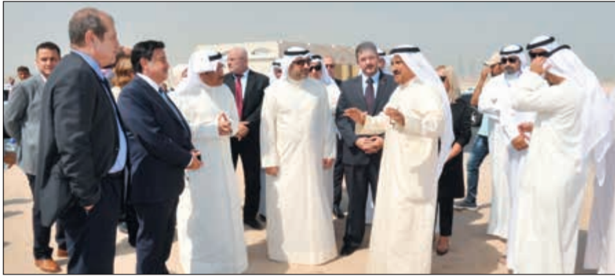
الوزير ياسر أبل والسفير مراد تامير خلال الجولة بموقع المشروع (زين علام)