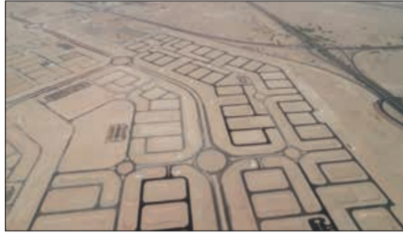
البنية التحتية للمرحلة الأولى من المشروع جاهزة

والتزام توفير التيار الكهربائي قبل انتهاء المواطنين من بناء قسائمهم. من جانبها شكرت المؤسسة العامة للرعاية السكنية في بيان لها التعاون والجهد الذي أبدته مؤسسات الدولة المعنية في مشروع غرب عبدالله المبارك والتي ترجمت حرصها على خدمة المواطنين عبر تعاونها المثمر مع المؤسسة وفريق عملها سواء بتوفير المتطلبات أو إزالة المعوقات والقيام بدورها وفقاً لأفضل وجه لإنجاز واحد من أضخم المشاريع السكنية التي تنفذها حالياً، مبيّنة أن أعمال المشروع تم بدء تنفيذها في 25 نوفمبر 2015 خلال مدة تصل إلى 730 يوماً تنتهي في 23 نوفمبر 2017. وشددت المؤسسة على التزامها بتطبيق القانون واللوائح والنظم والعقوبات على المقاولين المخالفين مع تقديرها في ذات الوقت لجميع المقاولين والشركات المنفذة التي تلتزم بمواعيدها