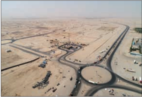
صورة جوية توضح الانتهاء من تنفيذ الطرق