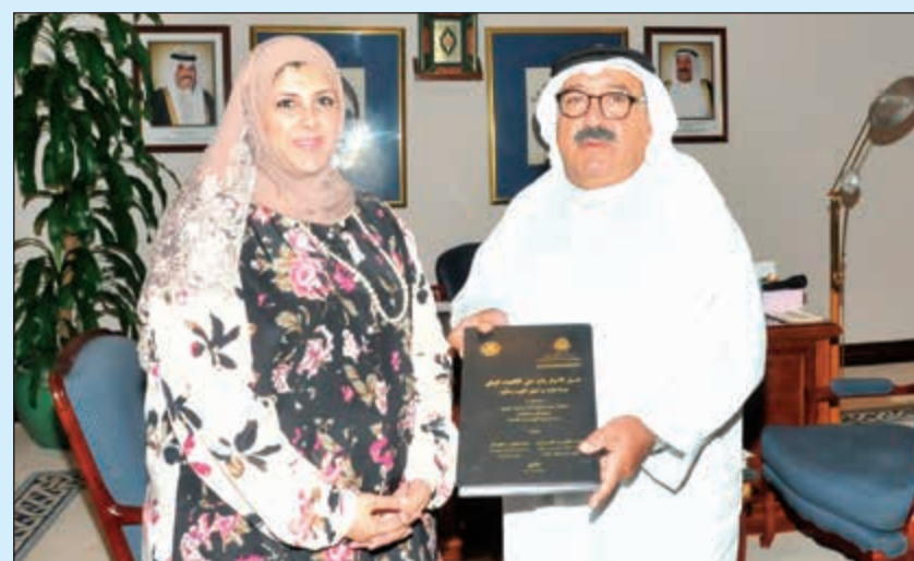
الشيخ ناصر صباح الأحمد مستقبلاً الشخبة بسمة سلمان الحمود