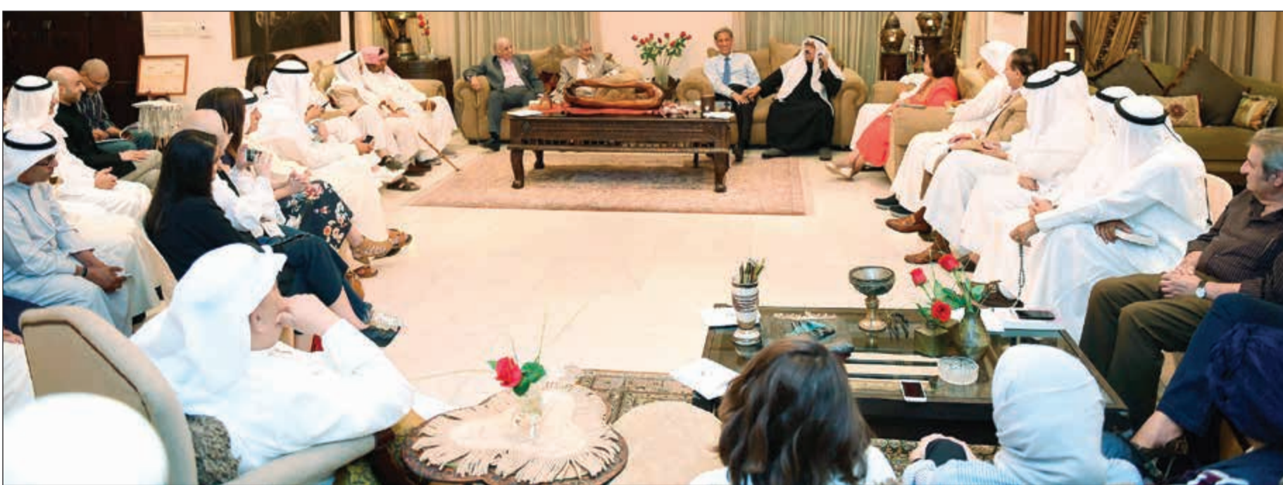
من أجواء الملتقى